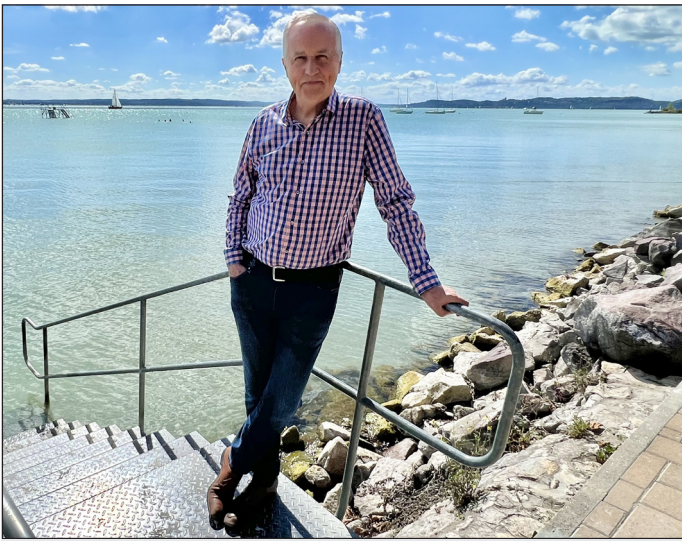
Dr. Kontrát Károly