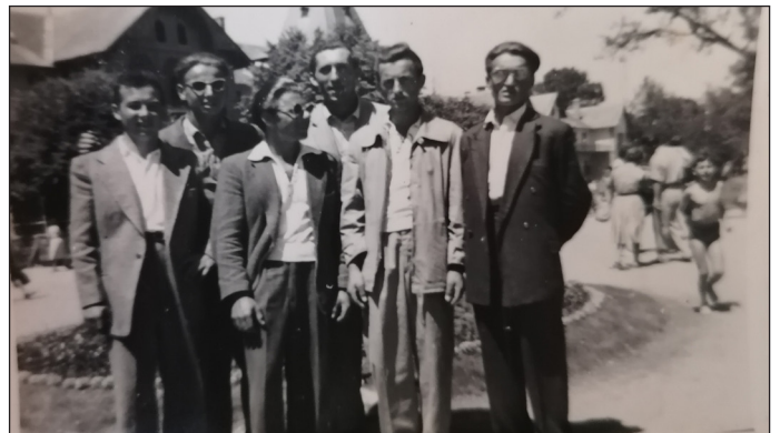
Lovasi fiatalok csoportképe az Ifjúsági Béketalálkozón, Keszthelyen, 1959