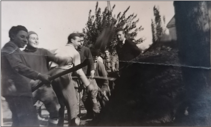
Épül a kocsmá Lovason, a falu fiatal férfijai társadalmi munkában ássák az alapot