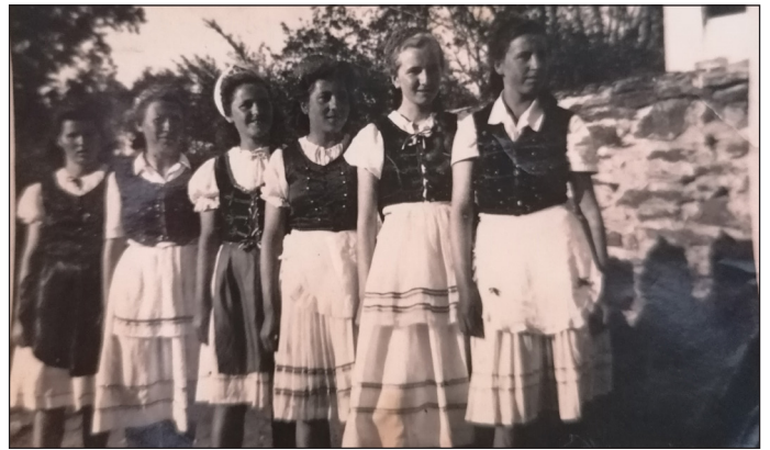
Lovasi DISZ szervezet lány csapata, magyar ruhában, 1950. május elsején