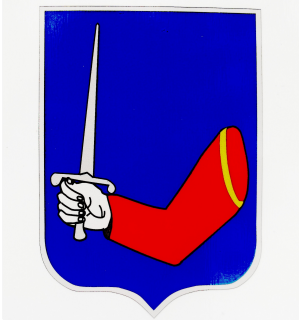
Pok nembeli Mórichidai család

A Móricz család a Pok /vagy Poki / nemzettségéből származott. Az említett nádor tagja Sabinát, a király lányát vette feleségül. Két gyermekük született, az ifjabb Moys, aki királyi tárnokmester lett és Erzsébet, akinek férje Medgyesi Miklós erdélyi vajda volt. A Móricz családnevet a Móricz nevű horvát bántól /1340/ származtathatjuk a későbbiekben. /Nagy Iván: Magyar nemesi családok./ A család dunántúli ágának egyik tagjáról nevezték el a Móriczhida nevű települést, ahol hidat építettek a Rábán. A család nem teljesen ismert körülmények következtében elvesztette a Szigligeti vár tulajdonjogát. Az utolsó, Móricz Simonról szóló egyértelmű tulajdonosi adat 1348-ból való, de 1424-ben a Laczk családdal kötött örökösödési szerződés után szűnt meg végérvényesen a család tulajdonjoga. Építési tevékenységükről konkrét adatokat nem tudunk, de az tény, hogy itt őrizték a Pok nemzettség kincseit, okleveleit, amelyek a vár fontos szerepét és erősségét mutatják. A XIII. század végén a várat elfoglalta Németújvári Péter, veszprémi püspök, aki a nemzettség kincseit elrabolta és azokat Veszprémbe vitette.