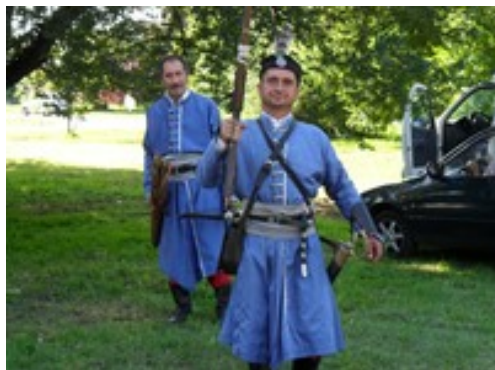
A Palonai Magyar Bálint vitézei szeptember 10-én bevonultak Lengyeltótiba