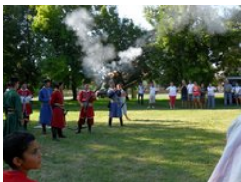
...golyó általi , szárnyas ló vásárlásra ítélték ... közben a tömeg megindult...