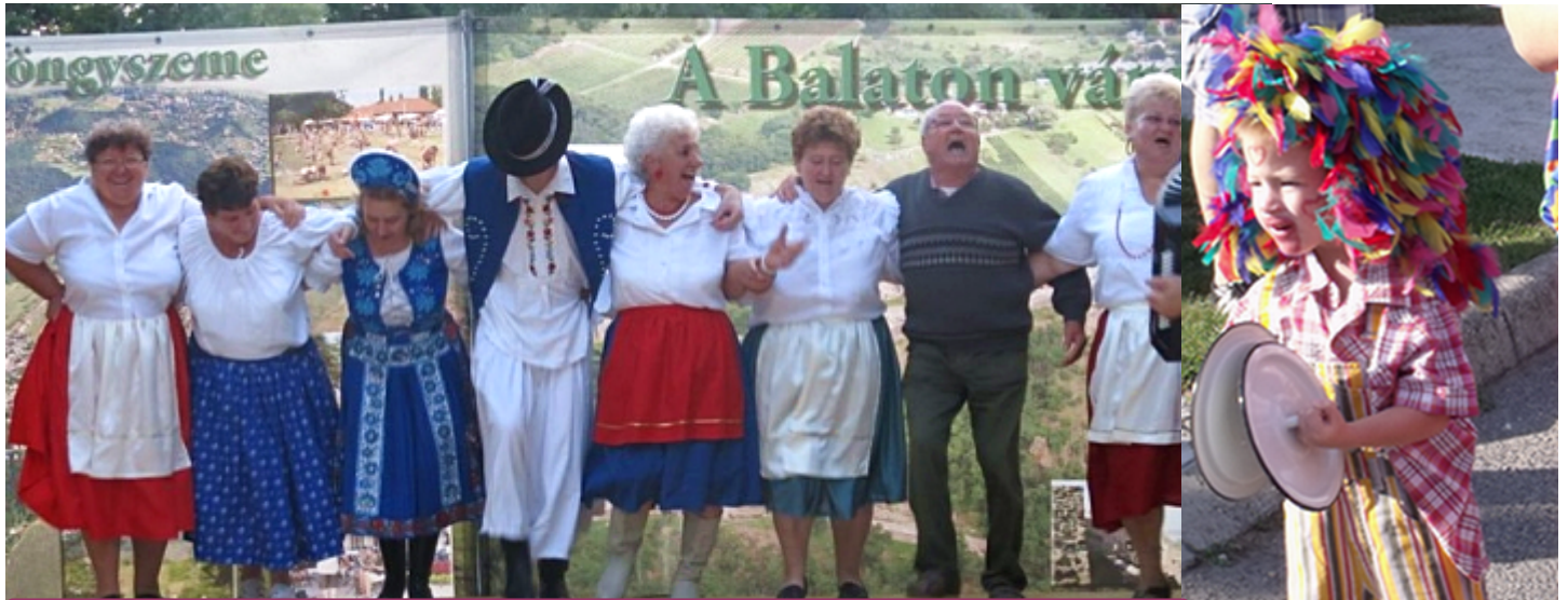
Fotó: www.infotapolca.hu ; Szigligetovari; Szigligetkönyvtáros