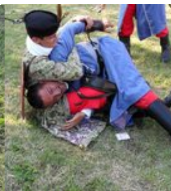
... erre Ropi kapitány tömegoszlatást rendelt el ... ez a parancs azonban nem tetszett az ifjú vitéznek , és jól helyben hagyta a kapitányt.