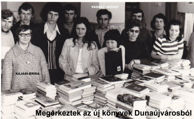
Megérkeztek az új könyvek Dunaújvárosból