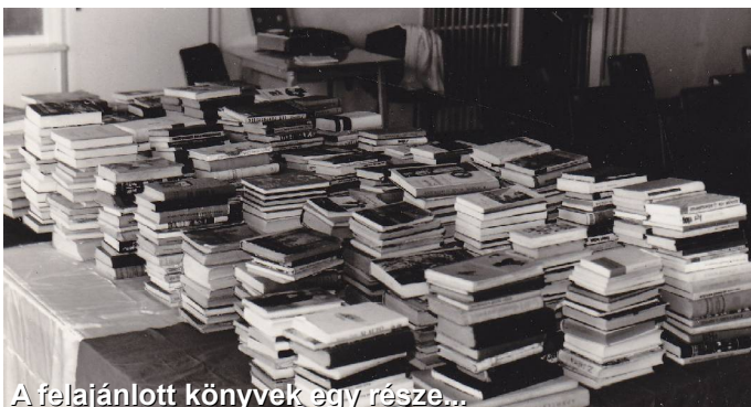
A felajánlott könyvek egy része...