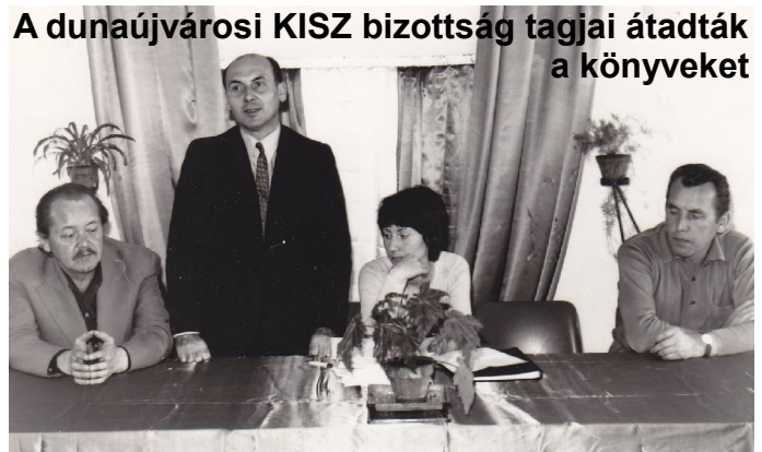
A dunaújvárosi KISZ bizottság tagjai átadták a könyveket