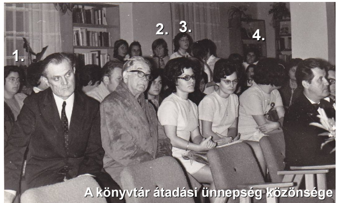
A könyvtár átadási ünnepség közönsége