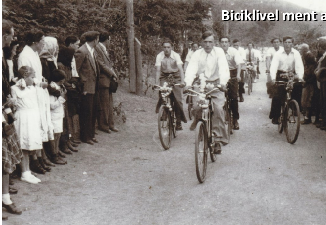
Biciklivel ment az ifjúság a püspök elé