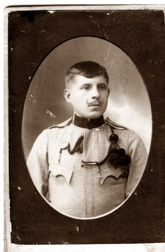
Kovács József (császár)