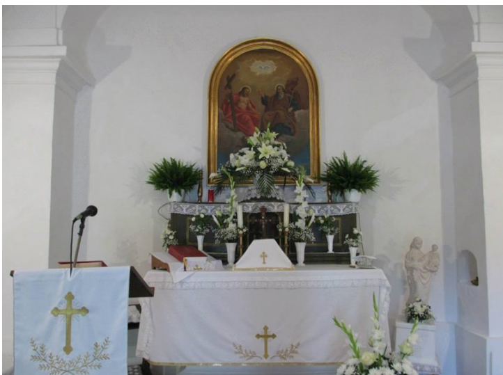
A Szőlőhegyi Szentháromság kápolna oltára