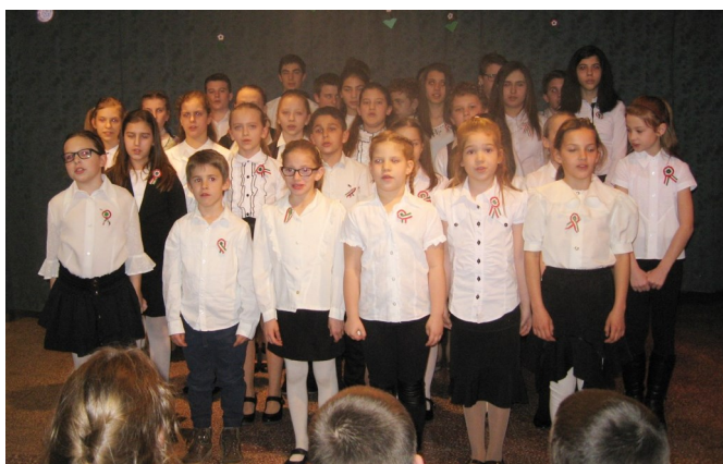
A szigligeti iskolások a 2017. március 15-i ünnepségen