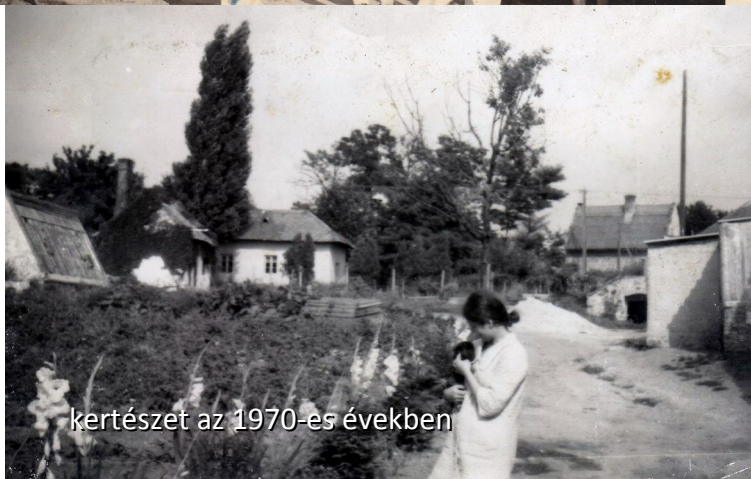
kertészeti az 1970-es években