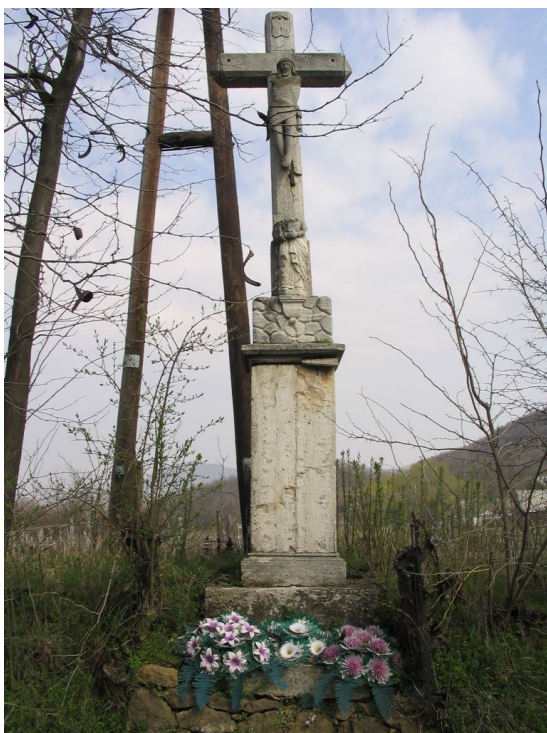
régi kereszt 1997