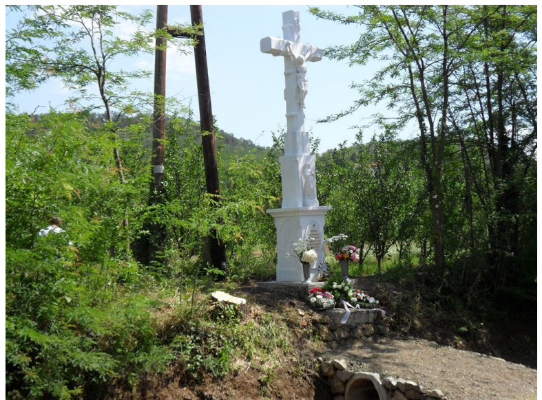
új kereszt 2012