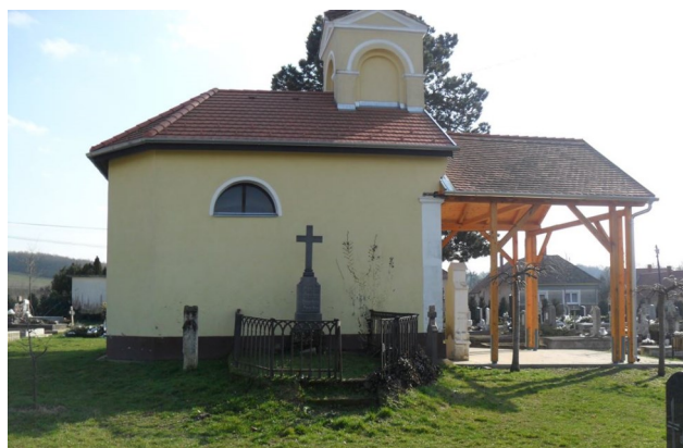
Kám, temető kápolna