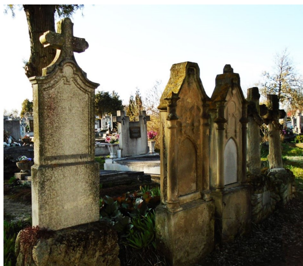
Szigliget, Puteani József sírkert

A képekhez tartozó cikk a következő számban várható.