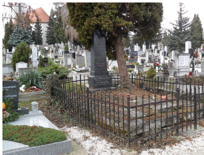
Kőszeg, temető (Szigliget 1836.02.10 - Kőszeg 1919.11.3)