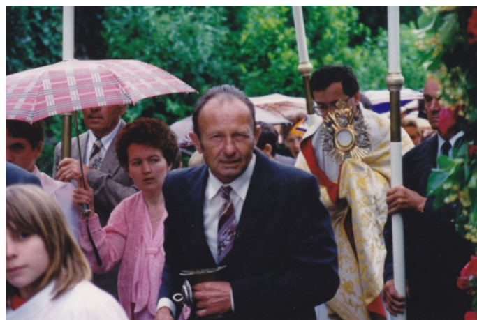
Takács József gyűjteményéből