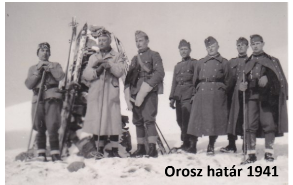
Orosz határ 1941