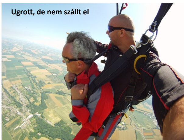
Ugrott, de nem szállt el