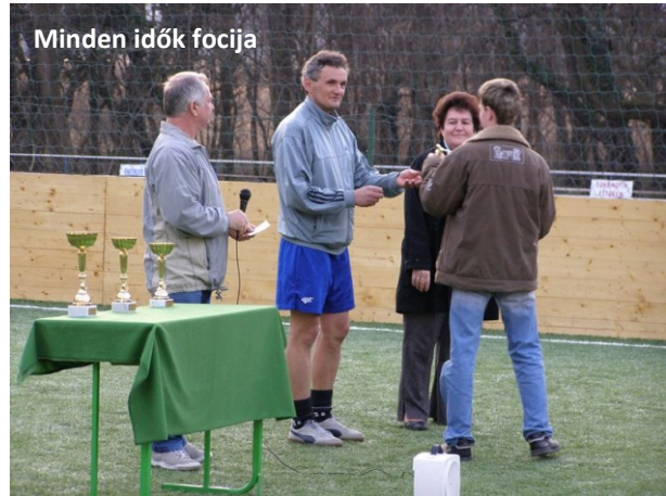
Minden idők focija