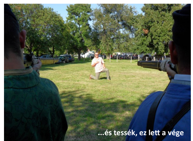
...és tessék, ez lett a vége