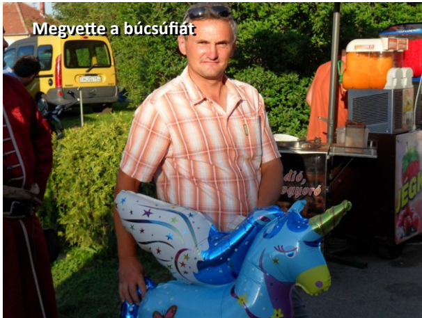
Megvette a búcsúfiát