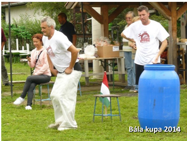
Bála kupa 2014