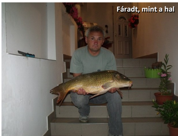
Fáradt, mint a hal