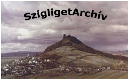
Takács József képei