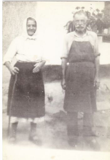
Ha valaki felismeri a képen szereplő személyeket, kérjük jelentkezzen!