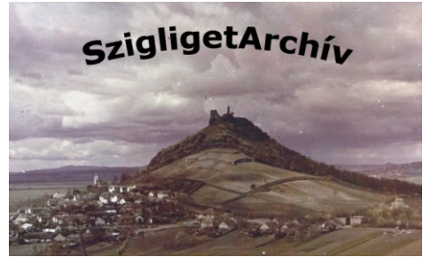
Takács József képei