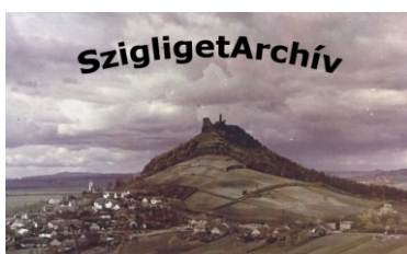
Takács József képei