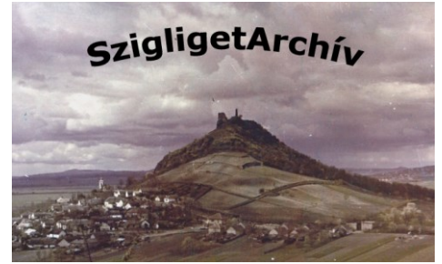
Takács József képei