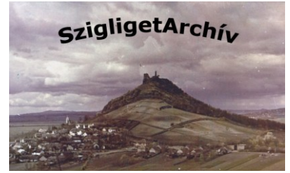
Takács József képei