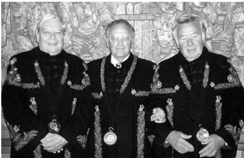
1996-os felvétel egy borrendi rendezvényről, balról Pozsgay Imre