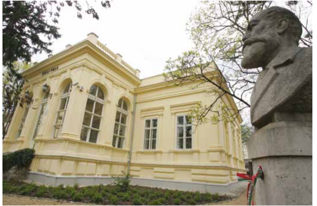
A szépen felújított Jókai-villa, udvarán a mellszoborral

Jókai házát, amelyben több híres műve mellett Az arany ember című regényét is alkotta, eredeti formájában állították helyre. A villa hat szobája részé- re az egész országból összegyű- jtötték és megközelítő húséggel összeállították a berendezést. Az emlékmúzeum sok értékes kincs- cel rendelkező kiállítás színe- lye is. Számos Jókai-dokumen- tum mellett bemutatja a nagy író