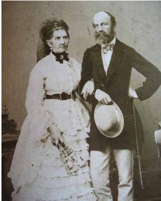
Jókai Mór feleségével, Laborfalvi Rózával