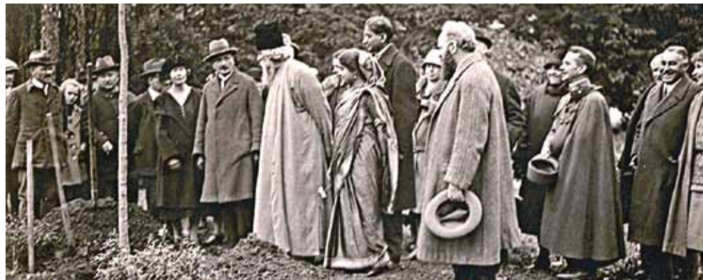
Tagore 1926 novemberében fát ültet a füredi sétányon

Ki előtt lenne ismeretlen a füredi Tagore sétány?