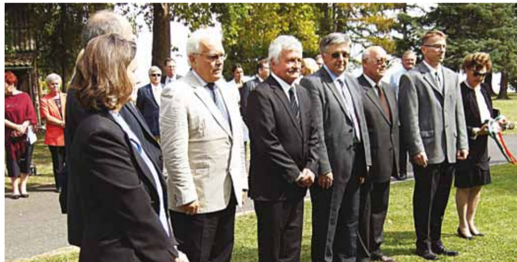
Az évfordulós ünnepségen az intézet vezetője és a vendégek

giai Intézet épületei folytatták, lezárva Habsburg József főherceg kastélyával. Tihany-Füredőtelep végül meg is valósult, az ötemeletes szálló kivételével.