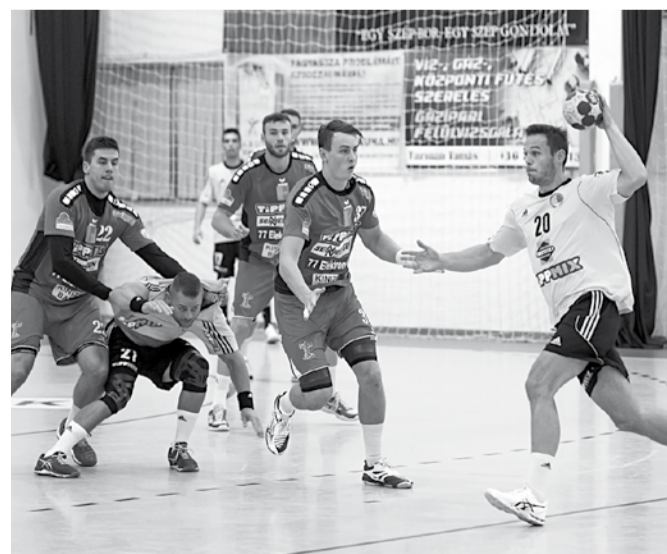
A balatonfürediek komolyan készültek az összecsapásra