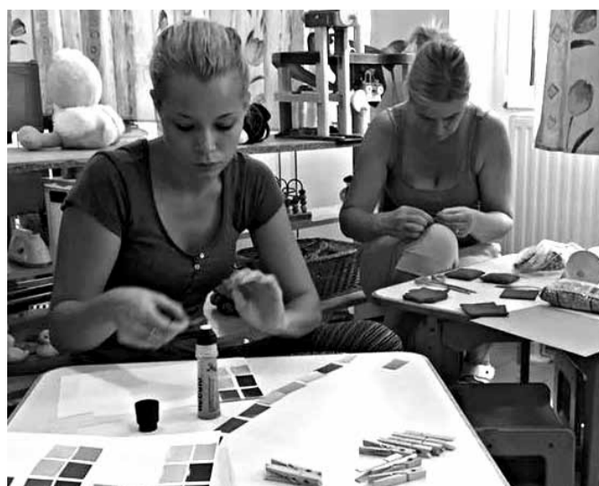
A Montessori-eszközök jó része házilag is elkészíthető

A négy csoportból kettő-kettő összenyitható, tehát a fizikai adottságok is indokolták, hogy két-két azonos csoportot indítsanak. A Montessori-csoportokban dolgozó négy nevelő lefedi a szabadságolási időt, ugyanaz a két terem felszereltsége, és tudják tartani a szomszédos teremben zajló, hasonló napirendet. „Nem lett volna értelme a Montessori-csoportban például csendjátékot tartani, ha a két helyiséget elválasztó üvegajtó túloldalán egy hagyományos csoportban épp szabad játék vagy ének van. Most a két csoportszobában azonos a napirend” – magyarázza az intézményvezető.