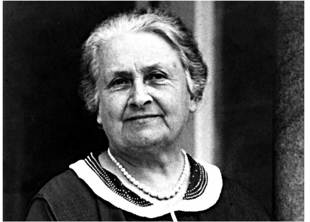
Az olasz orvos, pedagógus, Maria Montessori (1870–1952) módszerének alapelve, hogy öntudatos és önálló, boldog és szabad gyerekeket neveljenek a bölcsődék, óvodák, iskolák