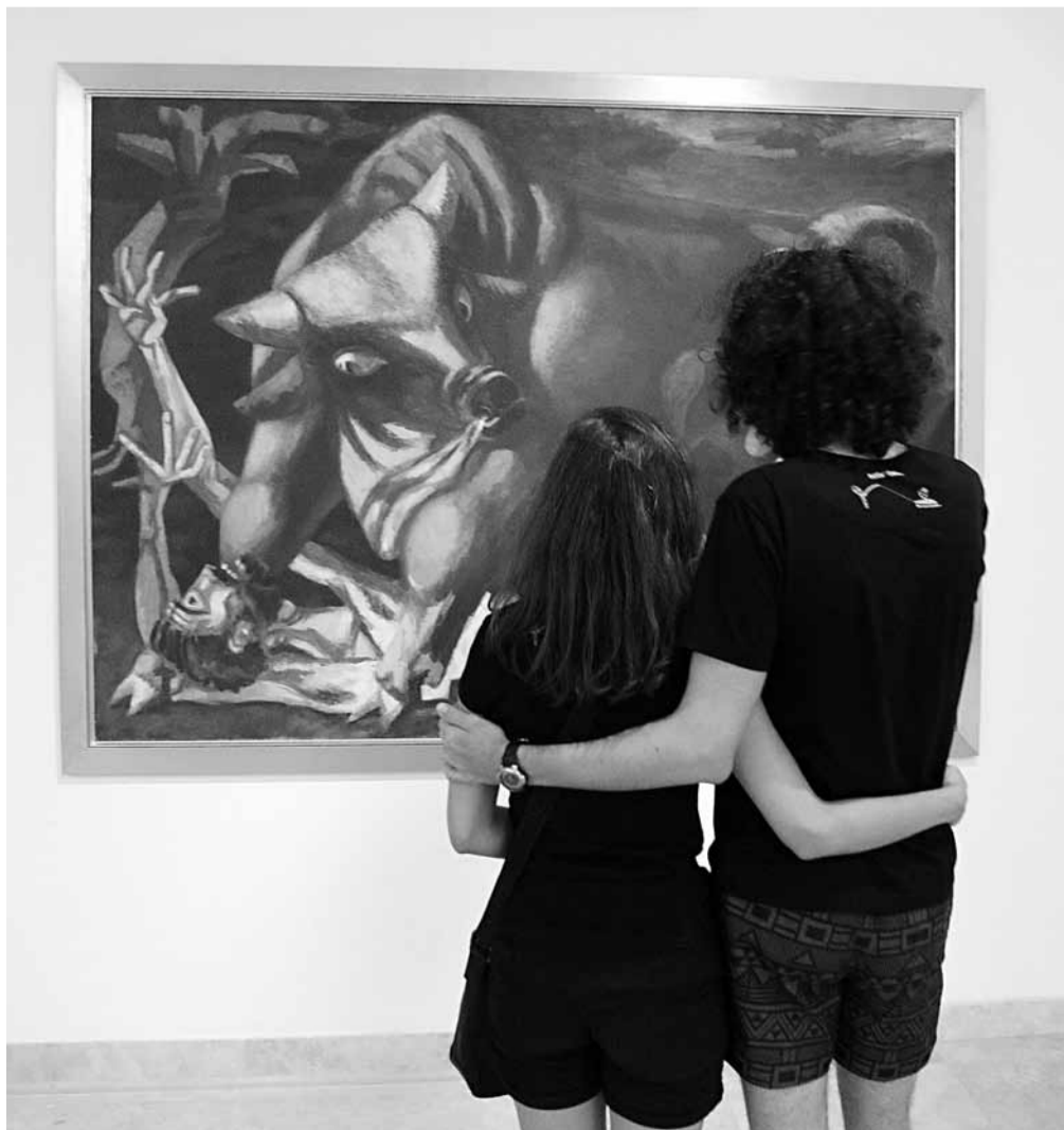
Duray Tibor műveiből nyílt kiállítás a Vaszary Galériában

A két nagy, térben is elkülönülő, tematikus szekcióra osztott tárlat a több mint fél évszázados életműből válogat, a harmincas évek diadalmas indulásától kezdődően egészen a nyolcvanas évekig. Duray munkáit a dekorativitás, a csöndes líraiság, az érzékeny megfigyelések és tomboló expresszivitás egyszerre jellemzik. Nagy tehet-