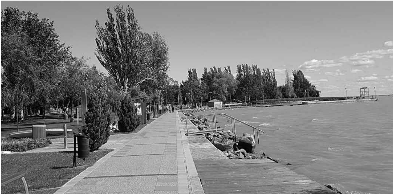
A strandok a fürdőszézon után is nyitva vannak és közparkként működnek

Tavalyhoz képest jelentősen nőtt a füredi strandok látogatottsága, amelyek kedvező időjárás esetén még egész szeptemberben nyitva lesznek. Komolyabb fejlesztések is zajlanak majd ősszel.