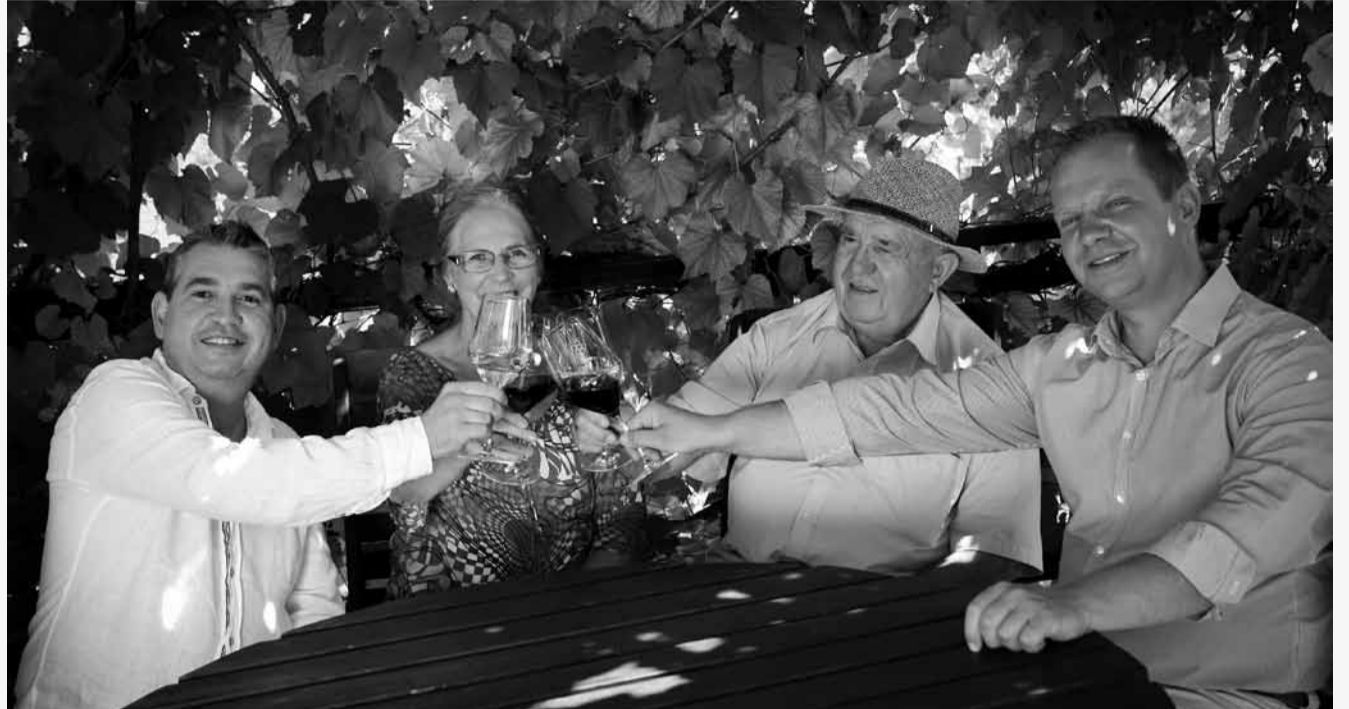
Söpteiéknél több generáció tapasztalata koncentrálódik a borokban

– 1995-ben úgy adódott, hogy a testvéremmel kimentünk Baden-Württembergbe, egy patinás szőlészethez dolgozni. Három hónapos kalandnak indult az egész, aztán