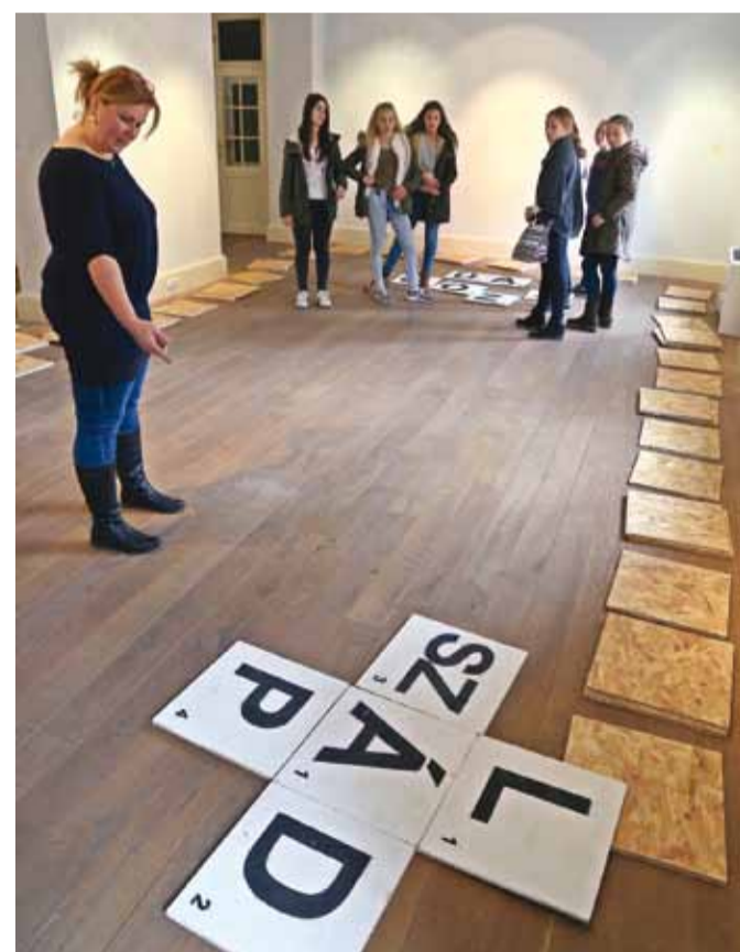
Művészeti foglalkozás a Vaszary Galériában

A kft. keretein belül nyolc művészeti csoport működik – fúvószenekar, vegyes kar, citerazenekar, hímszóműhely, dalkör, szenior néptáncgyűttes, képzőművész csoport, táncso-