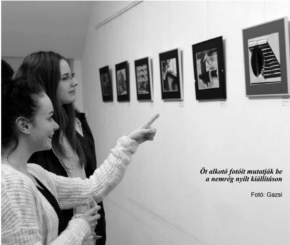
Öt alkotó fotóit mutatják be a nemrég nyílt kiállításon