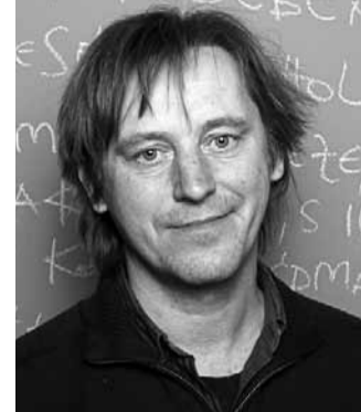
Háy János József Attila-díjas író, költő

– Van ez a szemlélet, hogy mindig korosztályokban gondolkodunk. A korosztályban viszont vannak ilyen, olyan meg amolyan emberek is. Minden ember, aki valaha volt kamasz, pontosan tudja – bár az én kamaszkoromban nem volt még számítógép –, hogy volt, aki olvasott kortárs irodalmat, és volt, aki nem. A kamaszok manapság is így vannak: van, ahol tapasztalom, hogy olvassák az írásaimat. Van olyan könyvem, amit nagyon szeretnek, például A bogyósgyümölcskertész fia, részben mert a kamaszokkal szólnak, részben mert azt gondolják, hogy a szüleik kamaszkoráról szól. És hát persze van egy csomó ember, aki nem fog olvasni. Rájuk sem kell követ hányani, mert lehet, hogy más irányból fogják megtapasztalni a világot. Mindenfajta