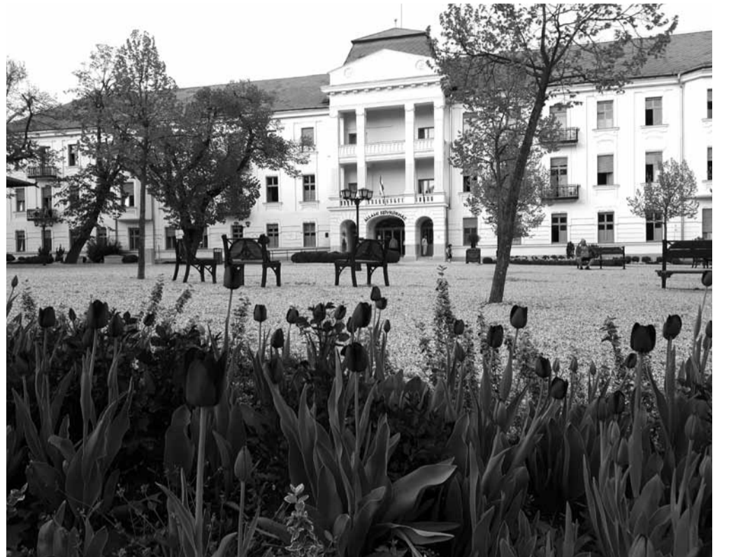
A felújítás során homlokzati nyílászárókat is cseréltek, illetve javult a betegszobák komfortja

Új kémiai laborautomatát helyeztek üzembe: az Olympus