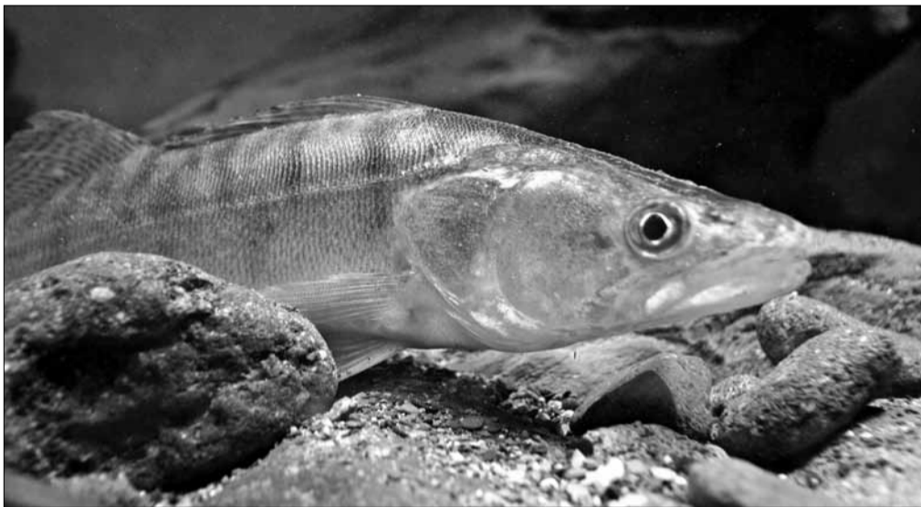
A fogassüllő, a Balaton legismertebb és legkeresettebb hala rövidesen hungarikum lesz