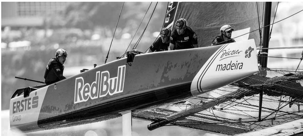
Az osztrák páros katamaránja 75 km/óra sebességre is képes