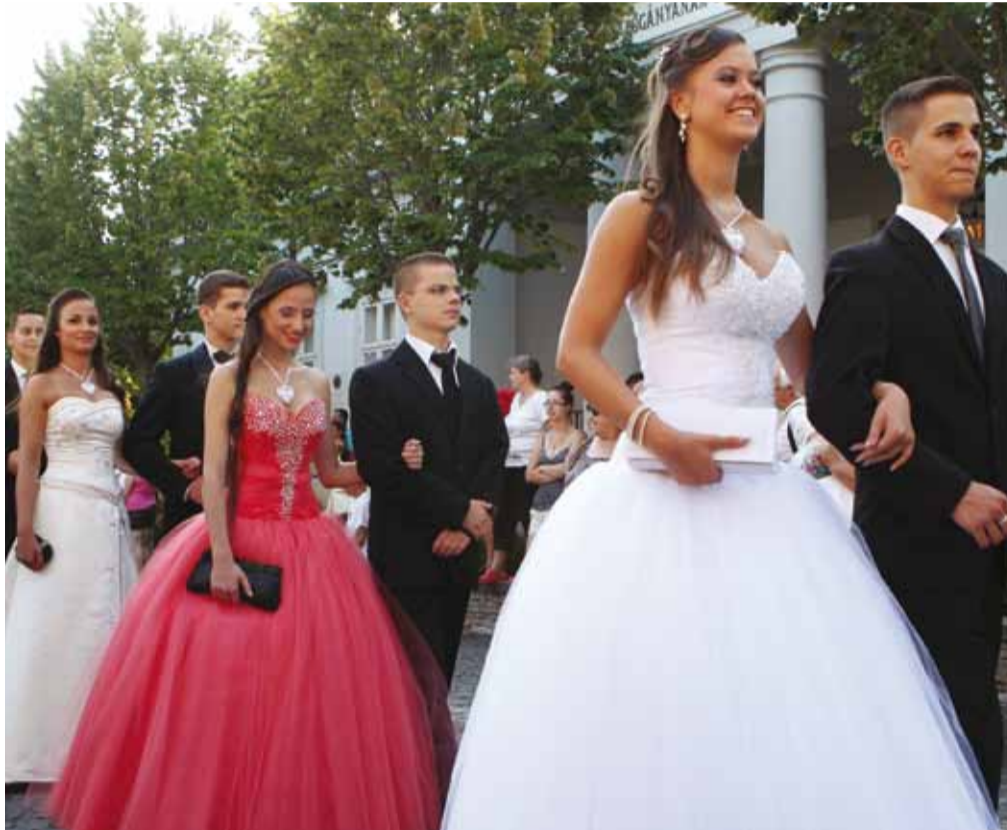
A bál bevonulás július 21-én, szombaton 18.30-kor kezdődik

A vendégek között lesz Roby Lakatos, a világhírű magyar hegedűművész, aki a Mendelssohn Kamarazenekar kíséretében együttesével fel is lép a bálon. A kiváló muzsikust a világ legnagyobb színpadain koncertezett már, nagy szerencséje a füredi bál