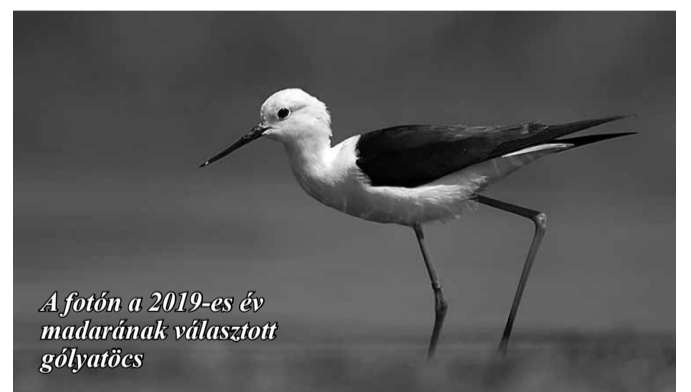
A fotón a 2019-es év madarának választott gólyatöcs

– a hosszú időn át tartó, egyoldalú kenyér- és egyéb értéktelen „táplálék”-diéta megbetegíti a madarakat (angyalszárnybetegség); – szennyezi a környezetet, rontja a víz minőségét, növeli a vizek szervesanyag-terhelését és az ebből eredő eutrofizációt (elmocsarasodást);