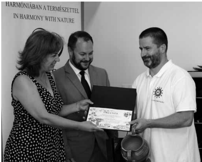
A Garamvári Szőlőbirtok képviselője átveszi az elismerést

A verseny a Pannon Egyetem Georgikon Karának szakmai irányításával és a Hegyközségek Nemzeti Tanácsa, valamint a Balatoni Borvidéki Borrégió védnökségével zajlott le. Az eredményhirdetést Balatonfüreden tartották meg, ahol több mint negyven gazdának ítéltek oda arany, ezüst, illetve bronz oklevelet. Ugyancsak itt adták át a legjobb fehér-, vörös- és rozéboroknak járó díjakat is. A szakmai zsüri döntése értelmében idén a balatoni borrégió legjobb fehérbora a Garamvári Szőlőbirtok 2017-es Savignon Blanc bora lett. A legjobb