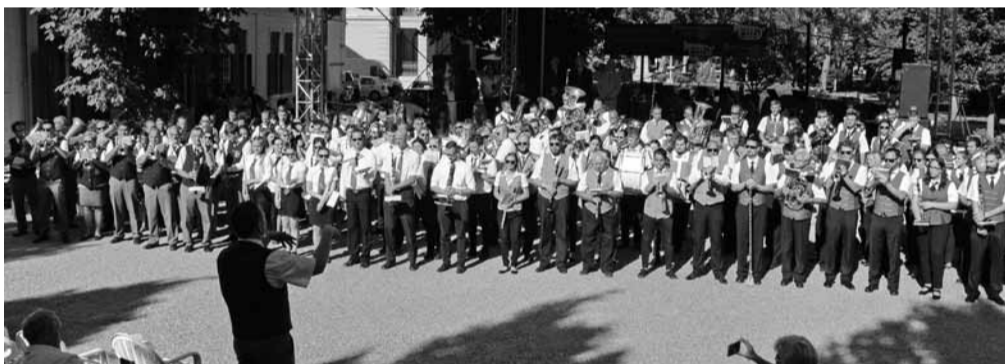
A nemzetközi fúvószenekari találkozó résztvevői a város több pontján is térzenét adtak

Az egész hétvégét kitöltő program során a zenekarok a város több pontján is adtak térzenét. Muzsikával szórakoztatták a közönséget a Vitorlás téren, Arácon a Hősök terén, a vásárcsarnoknál, a Szent István téren, a Szechenyi-szobornál, valamint a két füredi strandon is. A balatonfüredi ifjúsági és koncert fúvószenekaron kívül Kőszegről, Oroszlányból, Mosonmagyaróvárról, Veszprémből és a szlovákiai Nemesócsáról érkeztek együttesek. Az esemény gáláját a Kisfaludy színpadon rendezték, ahová látványos ünnepi menetben érkeztek a zenekarok. Itt Szabó Ferenc, a Győri Széchenyi István Egyetem Művészeti