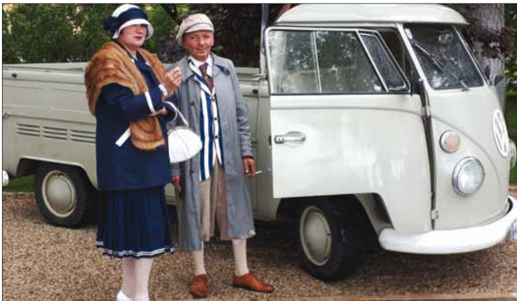
Autentikus viseletben a VW Transporterrel érkező pár