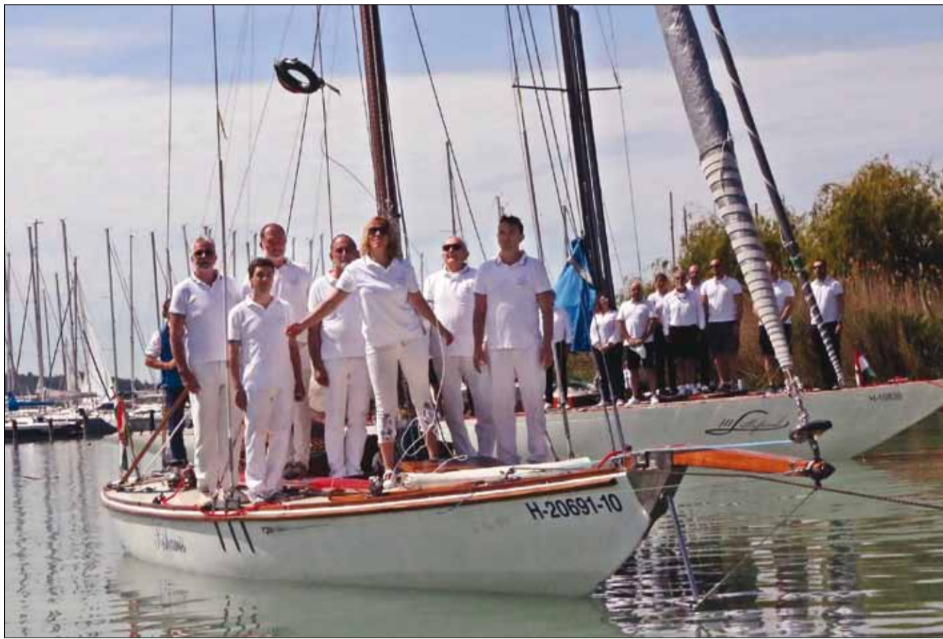
A több mint százhusz éves Kishamis fedélzetéről a hagyományoknak megfelelően megkoszorúzták a Balatont

– A Magyar Turisztikai Ügynökség jelentős forrásokat