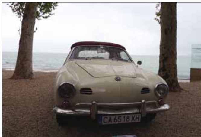
VW Bogár-alapokra készült a Karmann Ghia