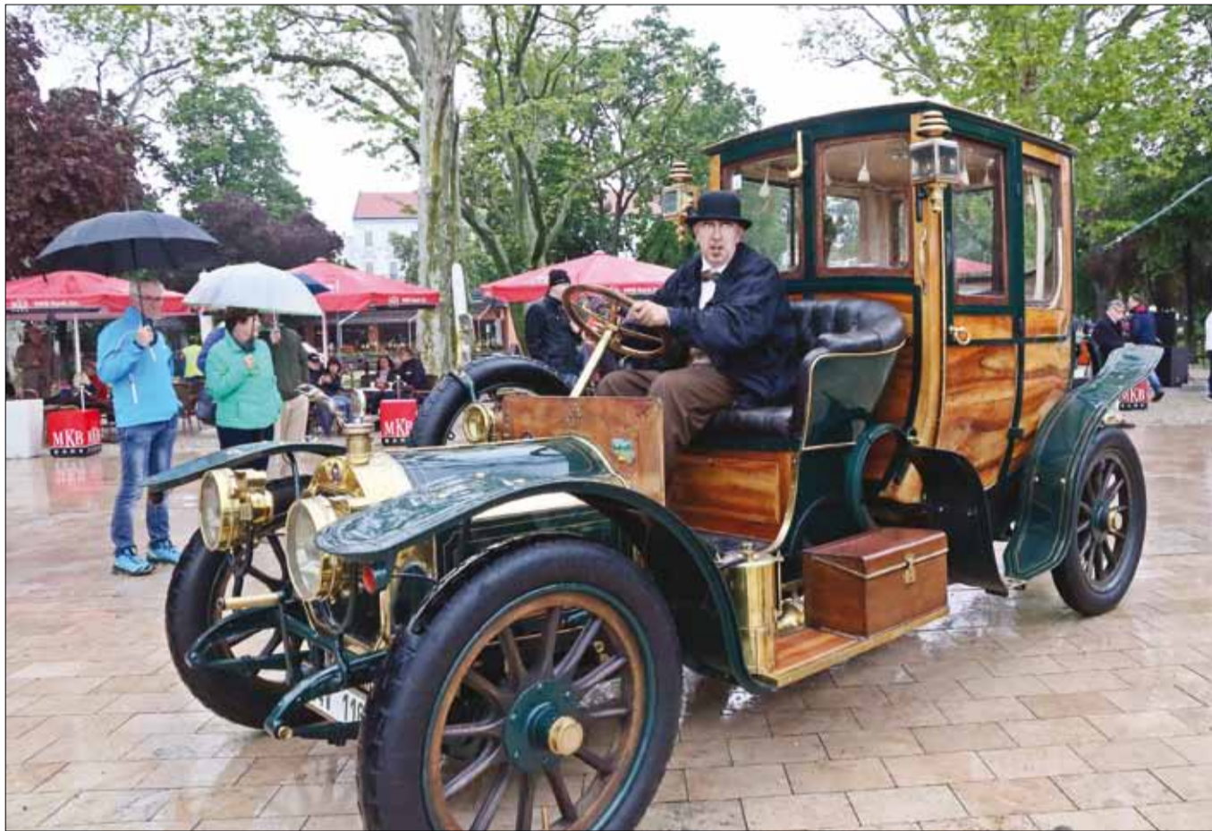
A fődíjas Lorraine-Dietrich az autózás hőskorából

Itt volt egy Isotta Fraschini 8A S típusú elegáns, nyitott túrakocsi, amely az elmúlt években több oldtimer-szépségversenyen is sikerrel szerepelt. A milánói ügyvéd, Cesare Isotta és a Fraschini