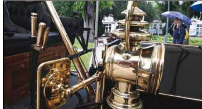
Pazar részletek egy 1904-ben gyártott Asterről

Az olasz autók elkötelezett hívei kedvéért egy Alfa Romeo 1900C Sprint Coupé is felsorakozott. Az 1950-ben bemutatott 1900-as típust „családi autó, amely versenyeket nyer” szlogenrel reklámozták. A Füreden látható autó egyik tulajdonosa egy csempész volt, akit a jugoszláv rendőrség 1958-ban letartott. Az autót elárverezték, s Belgrádba került. Az 1960-as évek végén a megfelelő alkat-