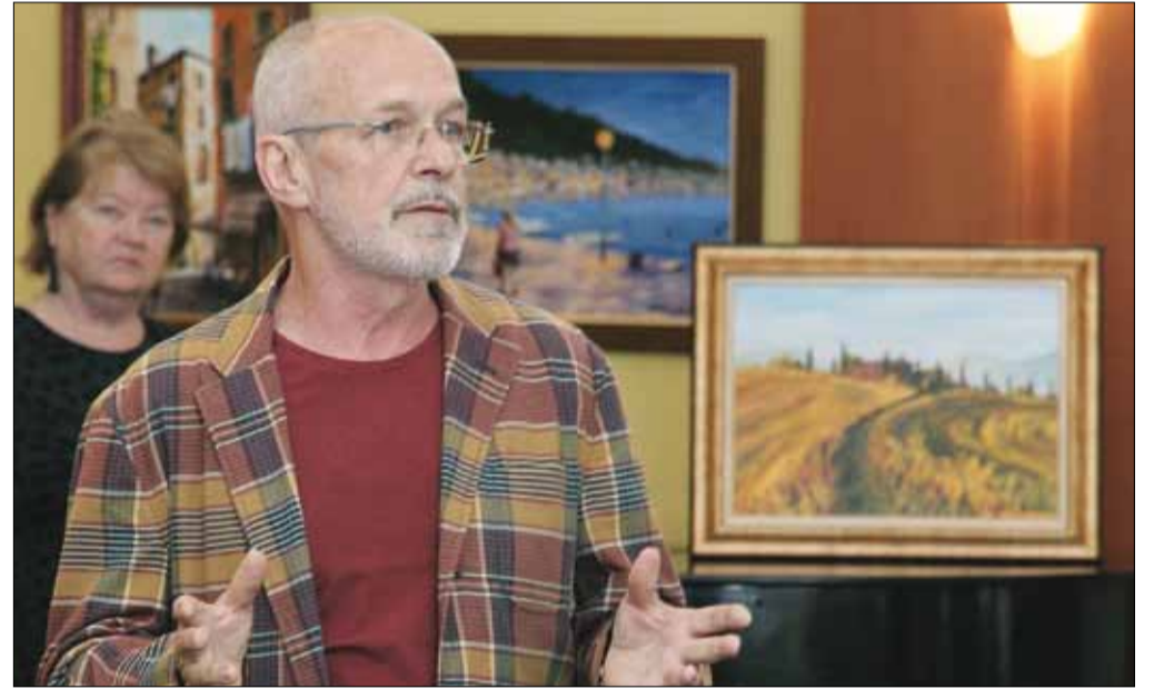
Nádas József kiállítása az Arácsi Népház nyitvatartási idejében látható június elsejéig