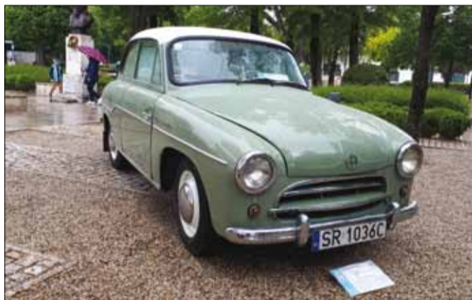
A lengyel Syrenát az 50-es évek közepétől gyártották