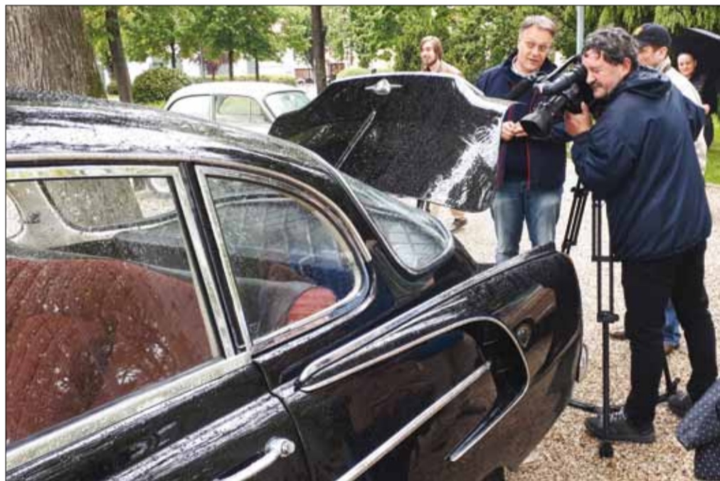
Tatra 603-as, a cseh csoda V8-as, léghűtéses farmotorral

fivérek együttműködéséből létrejött üzem 1912-ben kezdte el a saját tervezésű autók gyártását. A 8A a korszak egyik legnagyobb és legdrágább luxusautója volt, csak az alváza drágább volt, mint egy Rolls-Royce vagy egy Hispano-Suiza. A vételára akár a 20 ezer dollárt is elérte, átszámolva ma ez 80–90 millió forintot jelent. Az Isotta nemcsak drága, de menő autó is volt, a gyár ígérete szerint felépítménytől függetlenül 150 km/h sebességre volt képes.