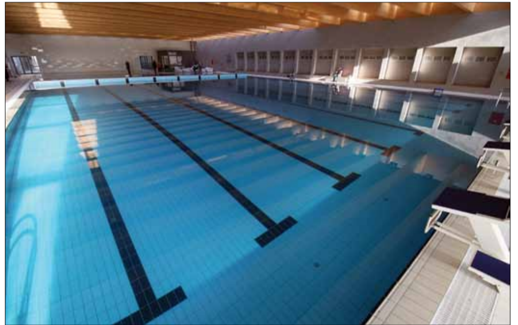
Balatónfüred, városi uszoda