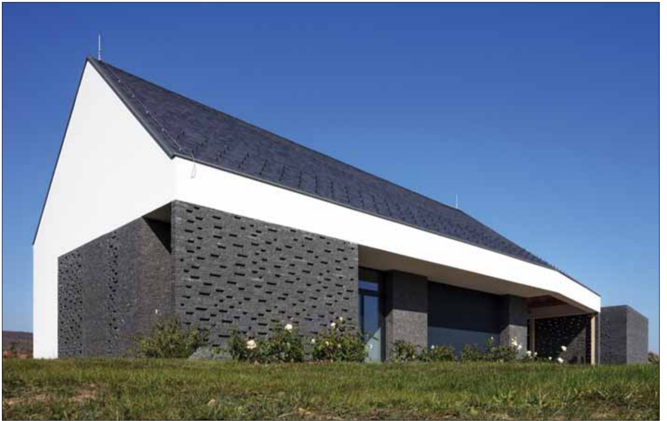
Mindszentkálai borász háza

A vasútállomás és buszállomás korszerűsítése, illetve bővítése a város rangjához méltó épület eredményezett. Az eredeti, 1972-ben elké-