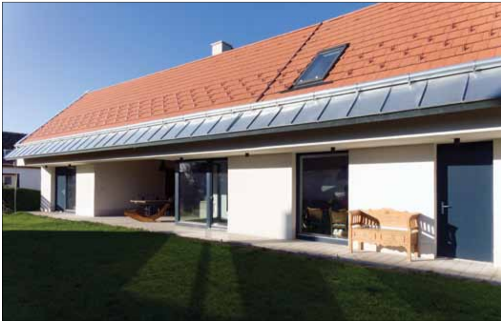
Dörgicse, a trombitás háza