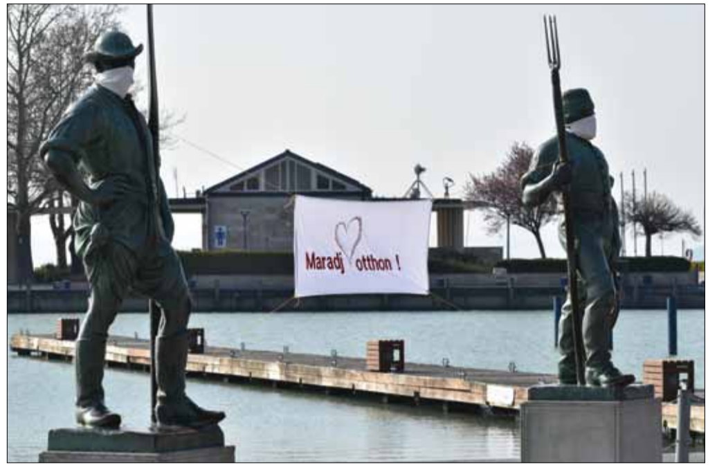
Óvatosságra és otthon maradásra buzdít a Halász és a Révész szobra

Az iskolák bezártak. Az óvodák és bölcsődék ügyeleti rendszerben működnek, külön kis csoportokban tovább biztosítják az ellátást és az étkeztetést azoknak, akik ezt igénylik. Az önkormányzat arra kéri a szülőket, lehetőség szerint a gyerekek maradjanak otthon.