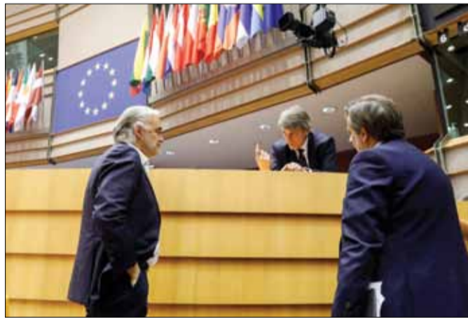
Rendkívüli plenáris ülés: középen David Sassoli, az Európai Parlament elnöke, a képviselők távolról szavaztak

– A reptéri „résidőkre” vonatkozó uniós szabályok ideiglenes felfüggesztése. Az intézkedésnek köszönhetően a légitársaságok leállíthatják a járvány alatt üresen közlekedő járataikat. A szabályok ideiglenes felfüggesztése miatt ugyanis a fel- és leszállásra használható időszávokat nem kell többé kihasználniuk ahhoz, hogy azokat a következő évről is megtarthassák. A