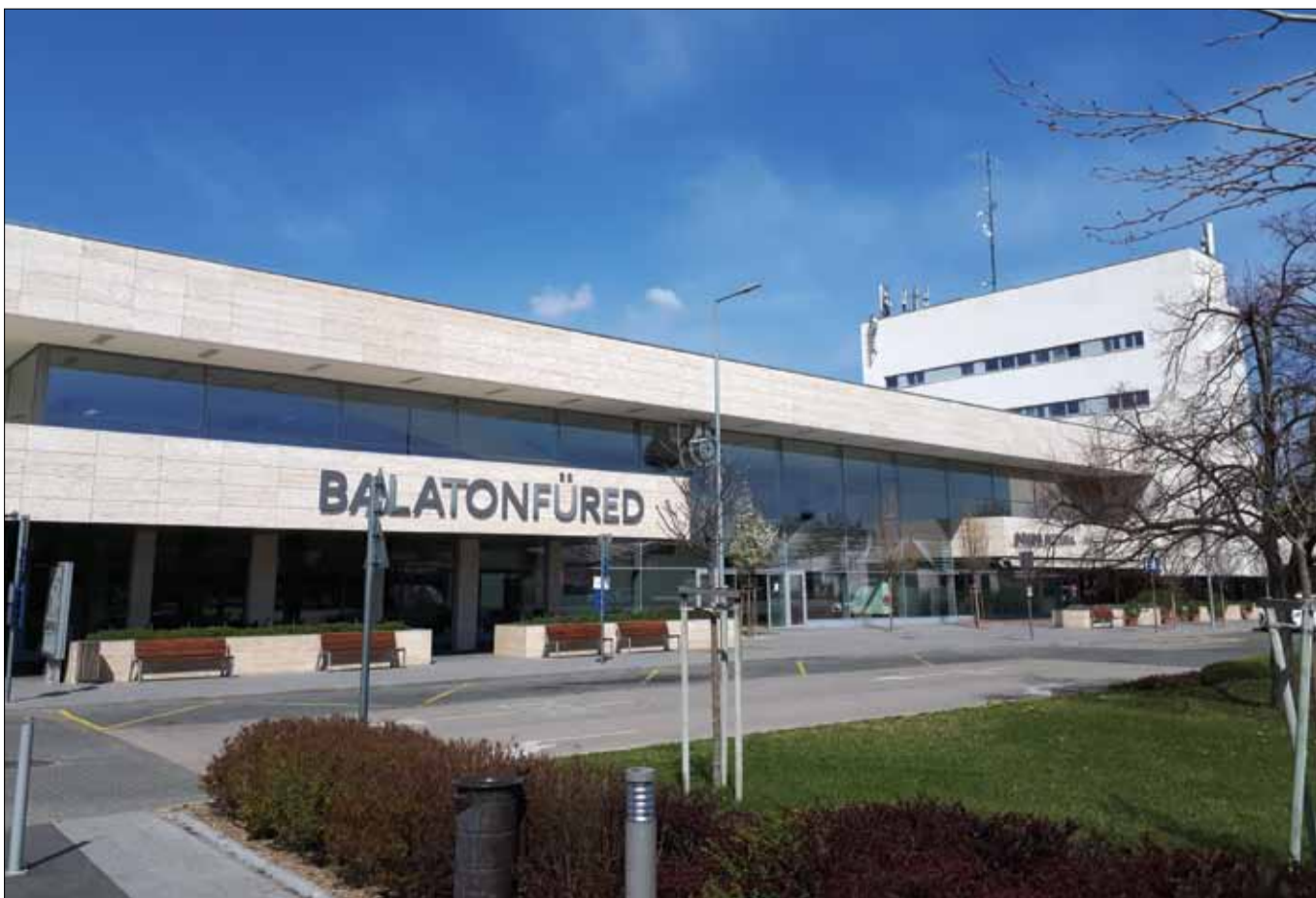
A balatonfüredi vasút- és autóbussz-állomás épülete

szült, Kővári György tervezte épület korának modern, magas színvonalú munkája volt, felújítása azonban egy új minőséget teremtett. Méltóságot, könnyedséget és eleganciát sugároz az épület. A nagy üvegfelületek használata, az új praktikus funkciók, valamint a vasút- és buszállomás épületeinek egymáshoz való viszonyulása színvonalas és nagyvonalú épületet eredményezett – hangzott el az értékelésben.