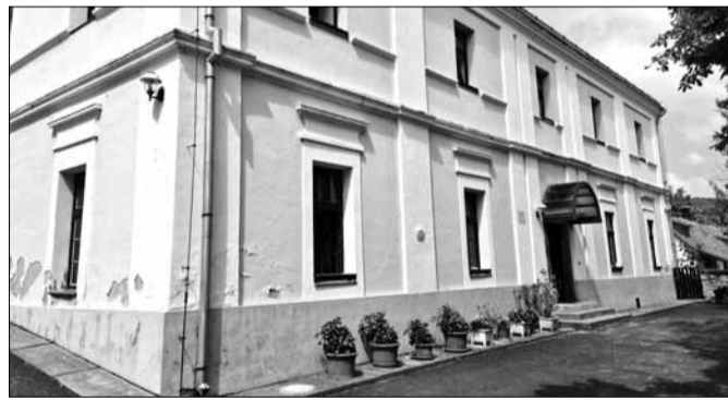
A főfalakon kívül nem sok minden marad meg az épületből

Idén szeptember 1-jétől a református egyház fogja működtetni a Mogyoró utcai óvodát. Az épület és az udvar teljes felújításon esik majd át, a munkák végeztéig a Vasút utcai és a lakótelepi óvoda fogad be egy-egy csoportot. A visszaköltözést 2021. első fél évére tervezik.