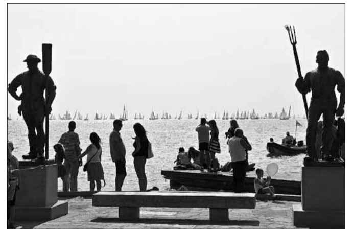
Balatonfüred népszerűsége évről évre növekszik

Ha az összes eltöltött vendégéjszaka száma alapján