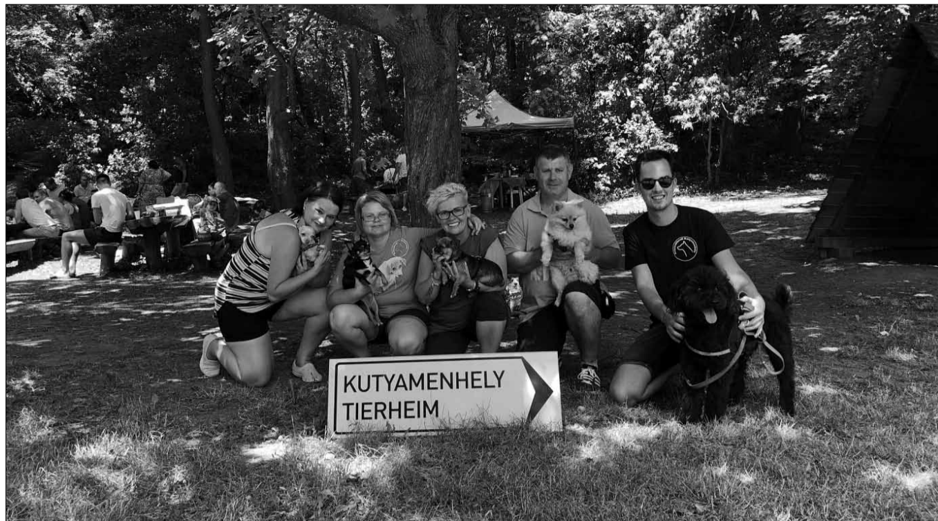
A Koloska-völgyben rendezett kutyás pikniken több mint százezer forint pénzdomány gyűlt össze