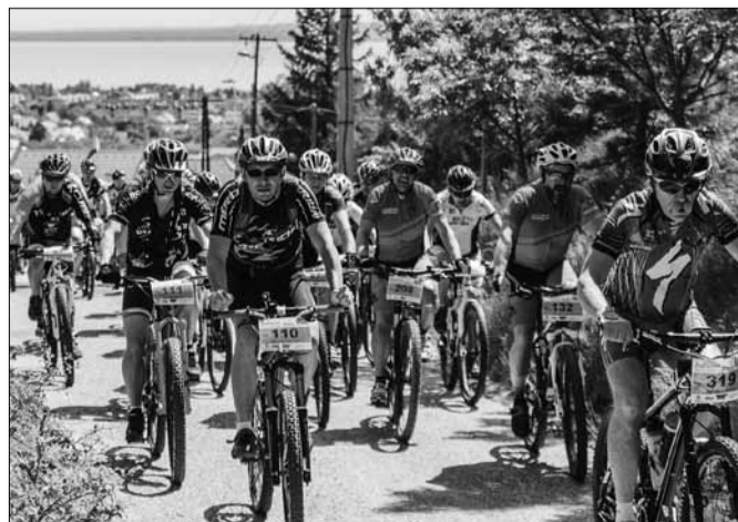
Mintegy hatszáz résztvevőt várnak a versenyre

A négy távon (15 km, 25 km, 45 km, 65 km) rajtoló versenyzők a Balaton-felvidék csodálatos tájain kijelölt erdei pályán haladnak. A mezőny átteker Balatonszőlősen, Barnagon, Váhszolyon és Pécse-lyen is, ahol a szurkolók testközelből biztathatják a versenyzőket.