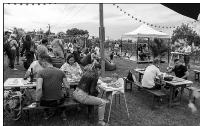
A borvacsorákat kulturális programok kísérik

A Balatonfüred-csopaki történelmi borvidéken több mint százötven éves termelői hagyományokkal rendelkező Söptei családi pincészet nem először kap elismerést a legjelentősebb francia borversenyen: 2017-ben a Hangulat