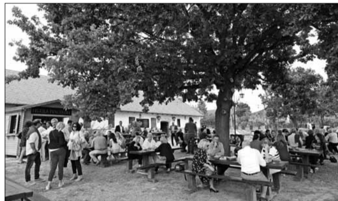
Finom falatokat és jó borokat kínálnak minden flanc nélkül