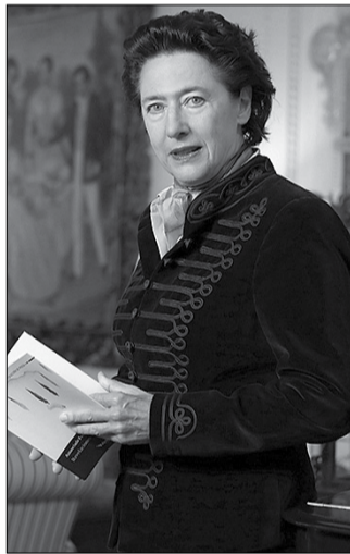
Anunciada Fernández de Córdova spanyol nagykövet

Hamvas esszéi a legkülönösebb utakra visznek minket, az emberi lélek legsötétebb és legcsillogóbb régióiba egyaránt elkalauzolnak, és prózája mindannyiunkat felvillanyoz. A legkülönbözőbb témákat érinti írásaiban, a zenét, az irodalmat, a művészeteket, a vallást, a filozófiát, de éppúgy a növényeket, gyümölcsöket, színeket és illatokat. Az élet és az életen túli dolgok határozott igénylése ez, és ez az talán, ami szándékosan botránys íróvá tette őt egy olyan korban, amikor az erkölcsösözök a gyönyörök, a vidámság, a szabadság vagy egy igazán jó bor által keltett érzés, megittasulás ellen emelték fel szavukat.