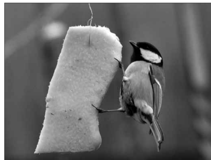
A szalonnát csak főzött állapotban függesszük ki!

Az énekesmadár-etetési időszak az első fagyok késő őszi beköszöntésétől ezek megszűnéséig, november második felétől márciusig tart. Az etető madárforgalma elsősorban a tél keménységétől, ezen belül is főleg a hótakaró vastagságától és tartósságától függ. Enyhe teleken az etetőket látogató madarak faj- és egyed-száma gyakran csak fele, harmada a megszokottnak. Az énekesmadaraknak adható téli madáreségek 3+1 csoportba