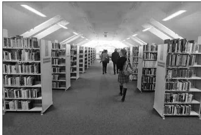
Az olvasók most nem látogathatják a könyvtárat, de telefonon vagy e-mailben leadhatják könyvigénylésüket

Az olvasmányok kiválasztásában segítség lehet a könyvtár honlapján található katalógus, ahol szintén az olvasójegy