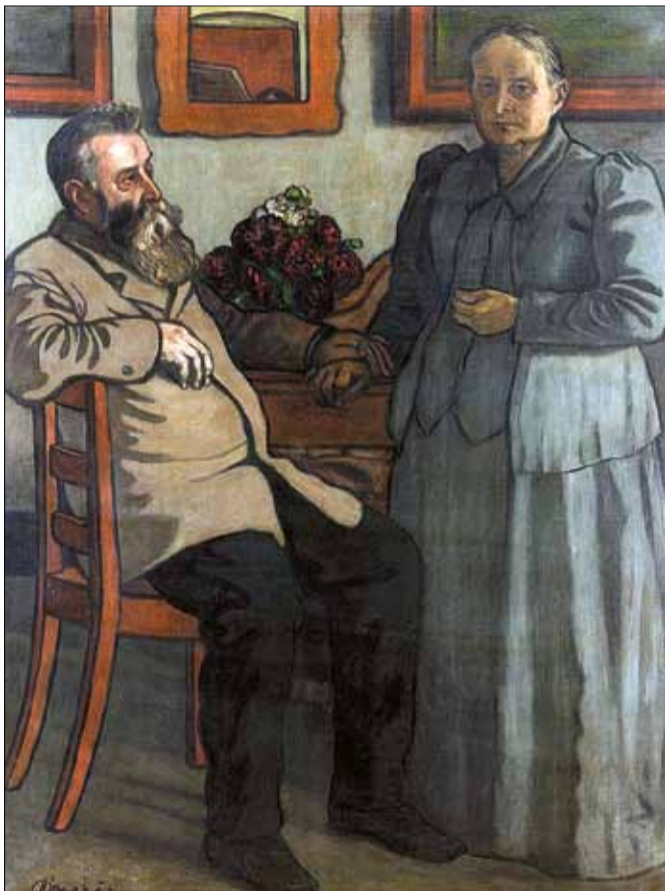
Rippl-Rónai József (1861–1927) Szüleim 40 év házasság után , 1897; Kiscelli Múzeum – Fővárosi Képtár

A Fővárosi Képtár modern és kortárs képzőművészeti gyűjteményéből származó válogatás 2023. január 8-ig tekinthető meg a Vaszary Galériában. BFN