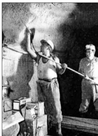
Kutatófúrás a föld alatt

tebb pontokon kutatóárkot, kutatóaknát ástak, fúrásokat végeztek. A kutatások a legteljesebb titoktartás mellett, szovjet felügyelettel folytak. A magyar kutatók napi jelentéseket adtak le, melyekből heti jelentések készültek. Ez utóbbiakat azonban már titkosították, és csak a szovjet tanácsadók ismerhették meg.