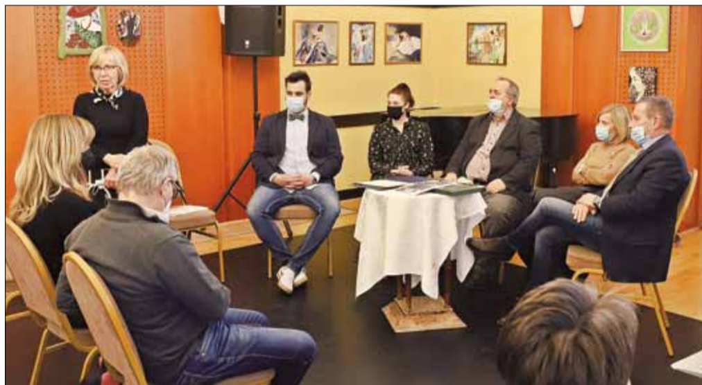
A Városi Értéktár Bizottság évente két alkalommal ülésezik

A füredi értéktár 2014 óta dokumentálja a település szellemi vagyonát. Bárki tehet javaslatot, így van esély a szubkultúrák, a hivatalos értékrenden túli, Füred identitását meghatározó értékek megjelenítésére is. Alakul egy átfogó kép az Anna-báltól a magyar boglárkán át a Baricska csárdáig. A 2012-ben hozott Hungarikum-törvény ugyan megszabja az értéktárba vétel menetét, valamint meghatározza a nemzeti érték fogalmát, tulajdonképpen bárki tehet javaslatot arra, mit tart a város értékének. Nem kell kizárólag magas, egyedi, tárgyias formában megjelenő értékekre gondolni. Minden szellemi,