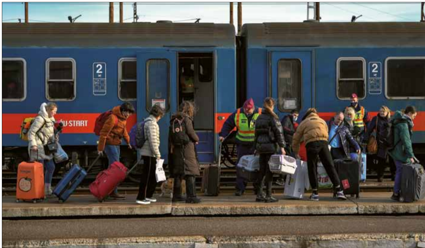
Az orosz-ukrán háború elől menekülő emberek a záhonyi vasútállomáson 2022. március 1-jén

A Balatonfüredi Szociális Alapszolgáltató Központ mostantól folyamatosan fogadja az adományokat, el-