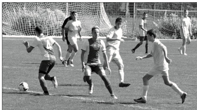
Bence alázattal, keményen dolgozott az edzéseken is

ahogyan edzőid is számtalanszor elmondták – mindened megvolt, ami ehhez a játékhoz szükséges.