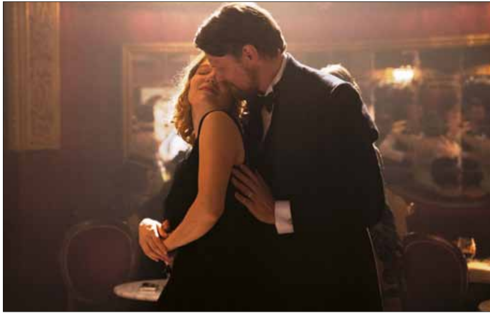
Jelenet a filmről, melyben a két főszereplő játékos paktumot köt

– Füst Milán túllógott azon a közege, aminek nagyon szeretett volna a része lenni – fogalmazott Enyedi Ildikó. – Először gimnázis-