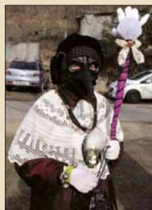
Jelmezes felvonuló és a lángoló kislebáb

A farsang utolsó napjaihoz számtalan vidám szo-