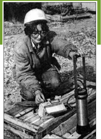
A fűrómagok előkészítése dokumentálásra

A magyarországi urán kutatás egy mellékszála, hogy a nagy sürgölődés felkeltette a CIA érdeklődését is. Az amerikaiakat főleg a szovjet befolyásszerzés aggasztotta. Az Internet Archive Wayback Machine amerikai nonprofit internetkönyvtára átláthatósága bizonyítékként a CIA százezres nagyságrendben töltött fel már elavult dokumentumokat, köztük a magyarországi szovjet atomkutatásról is. Egy 1957 nyarán kelt CIA-jelentés szerint a