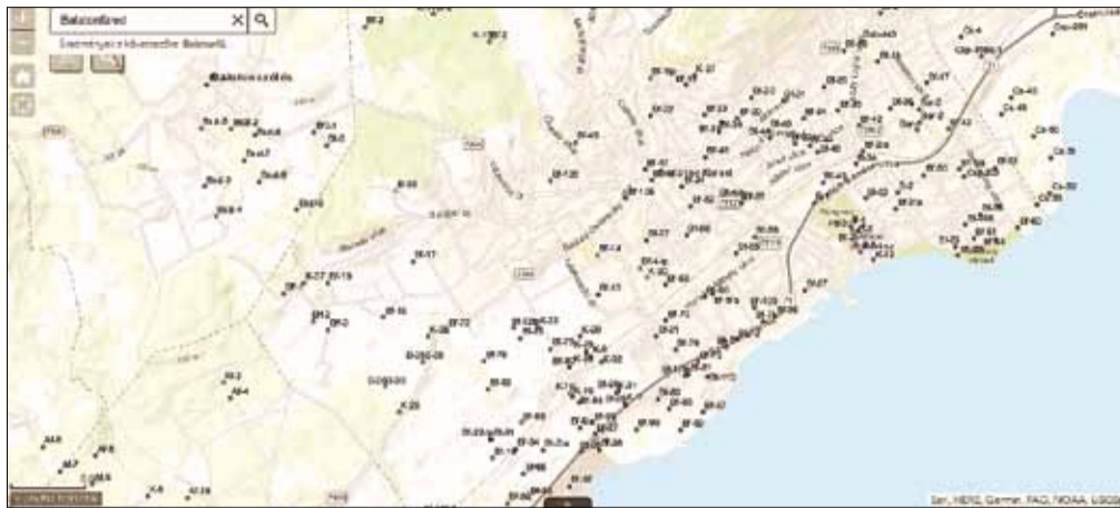
Uránfúrások Balatonfüreden és környékén