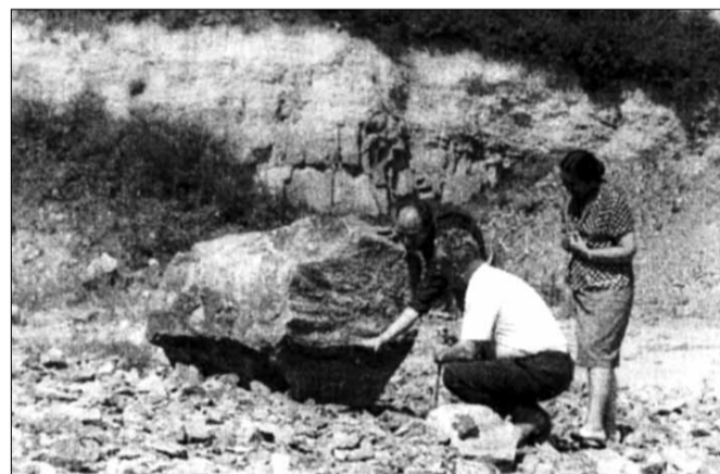
Terepmunka a Balaton-felvidéken

A legnagyobb munkára a Vászoly és Pécsely közötti