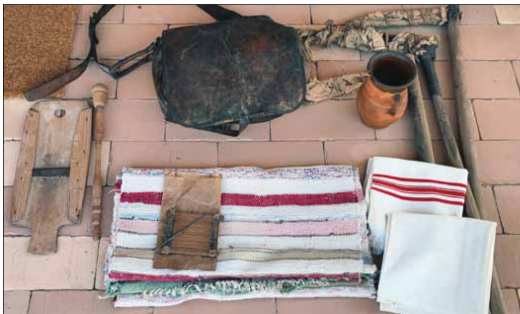
Az Arácsi Tájház kiállítására újonnan ajándékozott tárgyak