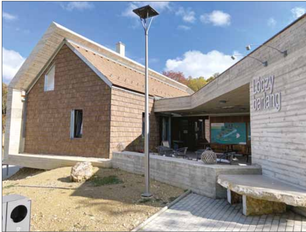
A Lóczy-barlang Látogatóközpont a Balatoni Szövetség különdíját nyerte el

A sorozat keretében szervezett találkozókra megtekinthetők lesznek Az Év