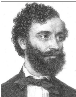
Tomory Anasztáz 1857-ben (Barabás Miklós rajza)

novemberi levelében. Molnár György, az ekkoriban Füreden fellépő pécsi szintársulat igazgatója egy 1859. januári bál bevételének felét ajánlotta fel a „házánk legelső fürdőhelyén” létesítendő új színházépület felépítéséhez. Erre azonban nem került sor, Ybl füredi színházépületének ter-