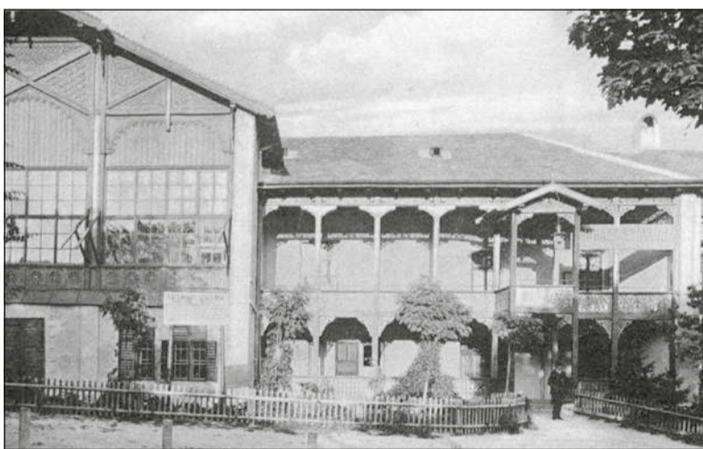
A szálló – a régi Glaser-féle épületrész – homlokzata 1912-ben

A gr. Eszterházy családtól 11 évre bérelt 43 holdnyi Füred-arácsi tóparti területen 1925. június 1-én, pünkösdhétfőn ünnepélyes keretek között nyitották meg a vasutasok balatonfüredi üdülőtelepét. Ekkortól a KANSz (Közszolgálati Alkalmazottak Nemzeti Szövetsége) kebelébe tartozó Vasúti Tisztviselők Országos Szakköre működtette az Esterházy-szállót is, amelyben egyszerre 60 vendéget lehetett elhelyezni 26 (más forrás szerint 22) szobában.