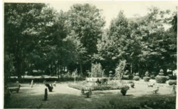
A Blaha-padtól keletre a buxus sövényt különbözőképpen formázták meg: volt itt asztal, rajta talpas poharak, az asztal mellett székek, mellette tyúk, kakas, ezt a részt baromfiudvarnak hívták.

A fürdő két oldalánál lévő két fa ágai a földig lehajoltak szinte egy-egy sátozt képeztek. A fa alatti piros padokon jókat lehetett hűsölni. Volt egy igazi, nagyobb szökőkút is, este ezt is kivilágították, gyönyörködtünk benne. A parknak ezt a részét a sziklával, hidacskaival, szökőkúttal japánkertnek hívták.