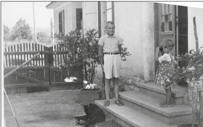
Családi ház a Kossuth- Segesdy utca sarkán. Unokatestvéremmel, a pápai diákkal.

Végre tavasz van. Kiszöktek a fák, kinyíltak a virágok. Megérkeznek a kirándulók, üdülők Füredre. Végigsétálnak a Tagore sétányon, gyönyörködnek a parkban, virágokban. Leülnek egy padra, előttük csillog a Balaton, vitorlások siklanak a vízen. A sétányon időnként biciklisek száguldoznak, igaz, a kijelölt úton, de a park nyújtotta szépség kárpótol mindenért. Különbösen csend van és béke. Mikor itt sétálok, a gyermekkori nyarak, a park nyújtotta titkok jutnak eszembe. Ezzel az írással a múlt ködbevesző emlékeit, a „boldog békeidőket“ szeretném megidézni, a teljesség igénye nélkül, úgy, ahogy a park csodavilága emlékeimben él. Füred ebben az időben tulajdonképpen két részből állt, a sínek fölött volt a falu, délre pedig a fürdőtelep - mi csak telepnek hívtuk. A falu járási székhely volt, szőlősgazdák, kereskedők, tisztviselők laktak. Élénk társadalmi élet folyt, őrizték a hagyományt, általában vallásosak voltak az emberek. A sínek alatt a telep egészen más világ volt. Gyerekkoromban a negyvenes évek elején a Kossuth Lajos és Segesdy utca sarkán laktunk, de a nyarakat az Ady utca és Nádor utca sarkán lévő házban töltöttem kereszt szüleimmél. Keresztapán a füredi állomás főnöke volt. Korán ment nyugdíjba, s mivel nekik nem volt gyerekük, unokatestvéremmel, a pápai diákkal - akire nagyon büszke volt a család, mert kitűnő tanuló volt - itt nyaraltunk.