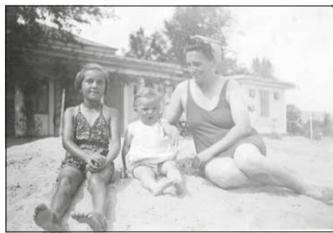
Anyukámmal és testvéremmel a fenéki strandon.

Ebben az időben Fürednek három strandja volt, a Fenék-fürdő, a hidegfürdő és az Esterházy strand. Nyáron, ha jó volt az idő minden nap jártunk a strandra. Kb. 10 éves koromig keresztapán kísért el. tíz éves koromban már jól tudtam úszni (fogalmam sincs, hogyan tanultam meg), ekkor már kíséret nélkül is elmehettem a barátnőimmel fürdeni. A feltétel az volt, hogy a déli harangszóra haza kellett érnünk ebédelni. Loholtunk is ész nélkül, mert ha elkéstünk nem engedtek vissza a strandra. Mi az uszodába jártunk. A bejárata a Széchenyi-szoborral szemben volt, így naponta végig mentem az Ady utcán, a Jókai utcán, a Blaha utcán és a parkon. Felejthetetlen nyarak voltak.