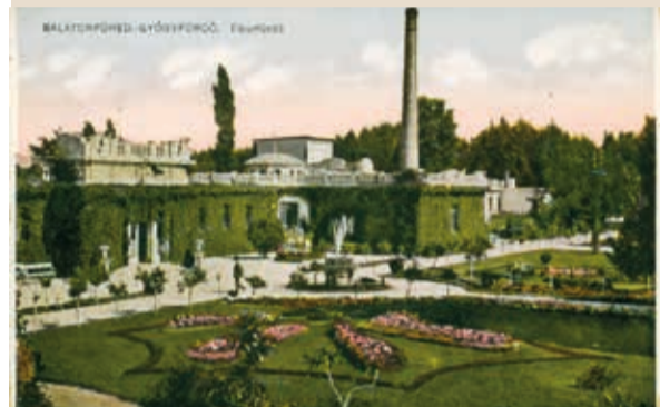
A Tibor-fürdő bejáratánál működött a kis szökő- illetve ivókút.

Az Antall-emlékmű mögött jó volt megpihenni a rózsalugasban, amelyre főleg rózsaszín babarózsákat futtattak fel. A lugas padjai még ma is megvannak, néhány lépcső vezet le az emlékműhöz. Az emlékművel szemben virágokból kirakott, színes országcímerben gyönyörködhettünk.