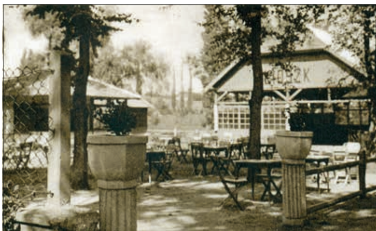
A parti sétány melletti kedvelt kioszk 1926-ban