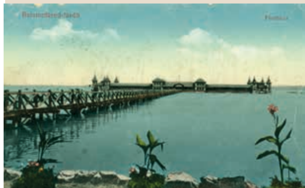
Az uszoda cölöpökön állt a vízen, fahíd vezetett a bejárathoz. A híd bejáratának két oldalán kis üzletek voltak, gyümölcsöt, édességet, apró ajándéktárgyakat árultak itt.