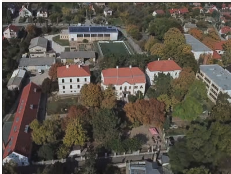
A Szent Benedek Középiskola és Kollégium épületei