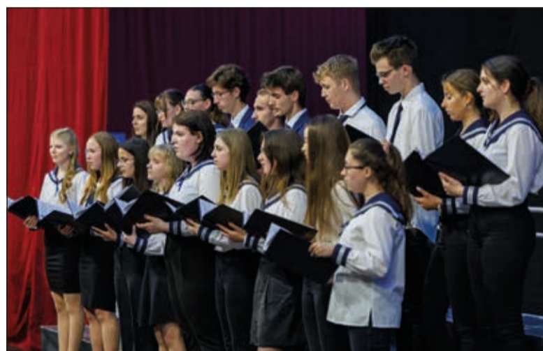
Lóczy Lajos Gimnázium Kamarakórusa