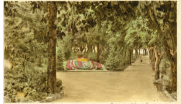
Balatonfüred gyűjtemény. Balatonfüred, Tagore sétány, Jókai emlékmű, Parkház.

A képeslapok a Lipták Gábor Városi Könyvtár gyűjteményében találhatóak.