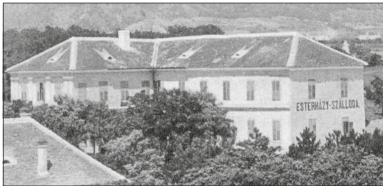
A szálloda épülettömbje 1905-ben

hajókiránduláson lévő vidám hölgytársaság 1915 július végén, akik azonnal citromos teát, mosónét, vasalónót, fodrásznét stb. rendeltek és ezeket ott meg is kapták.