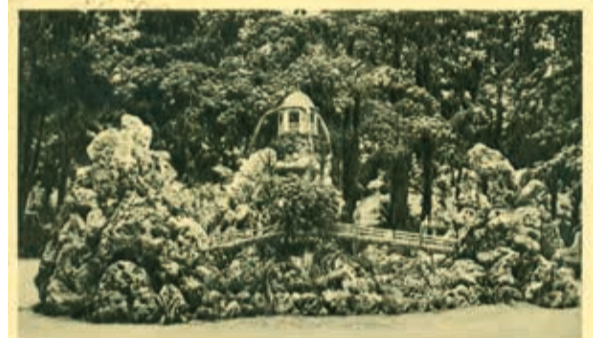
Balatonfüred-fürdő Japán parkrészt

A fürdő két oldalánál lévő két fa ágai a földig lehajoltak szinte egy-egy sátozt képeztek. A fa alatti piros padokon jókat lehetett hűsölni. Volt egy igazi, nagyobb szökőkút is, este ezt is kivilágították, gyönyörködtünk benne. A parknak ezt a részét a sziklával, hidacskaival, szökőkúttal japánkertnek hívták.