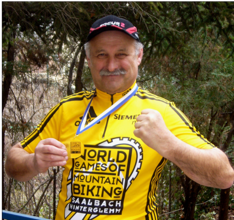
Kategóriájának győzteseként a Saalbach-ban rendezett amatőr kerékpárversenyen

- Vagyis közel három évtizede dolgozik a kerékpározás ügyén.