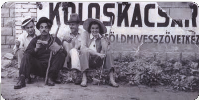
A csárda előtt 1949-50.