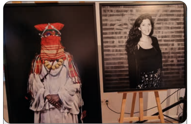
Leia Alaoui fotója egy népviseletbe öltözött nőről készült, amikor portrékat készített a marokkói törzsekről. A fotóművész "divatfotó" technikával dolgozott.