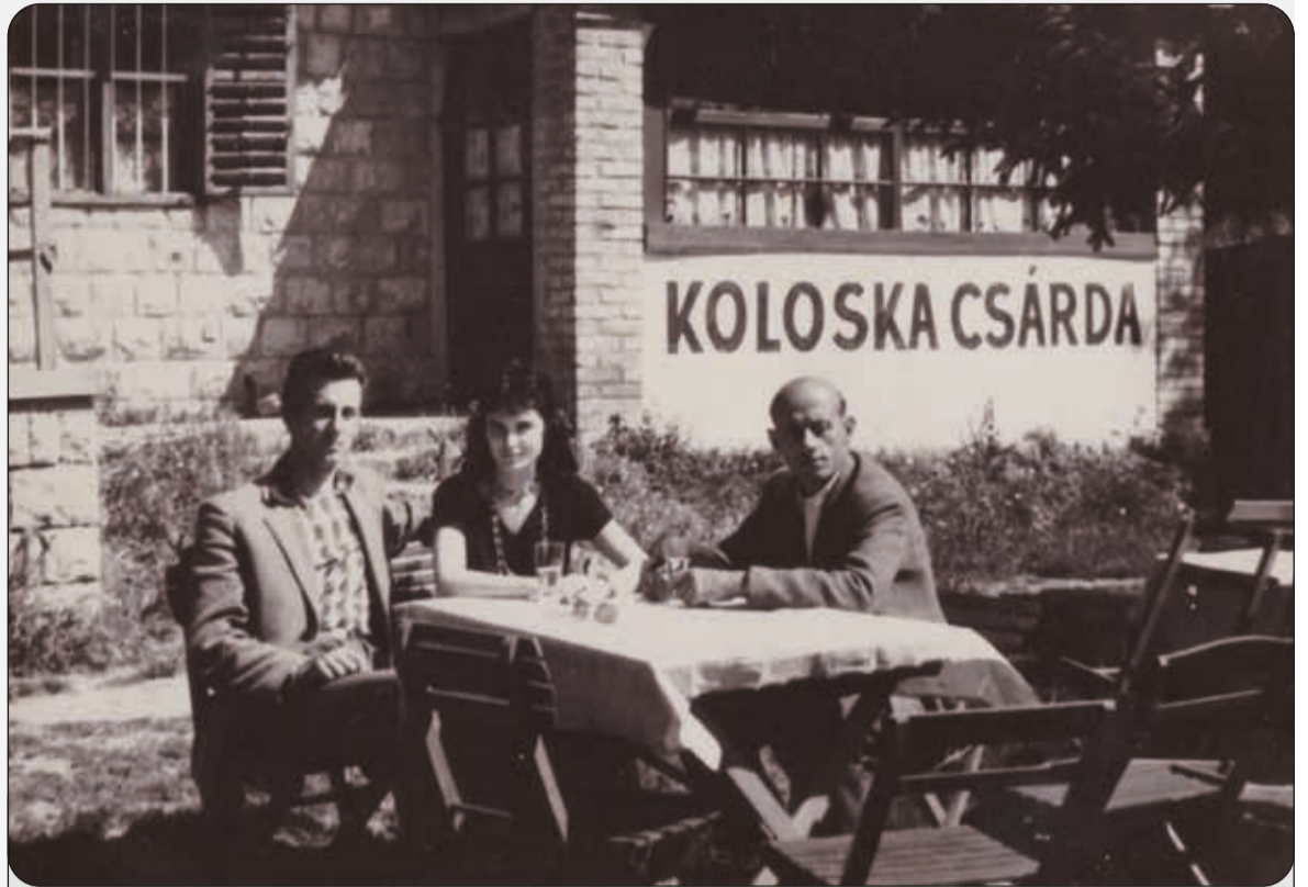
A csárda 1949-ben nyitott meg, rá egy évre a működtetést államosították