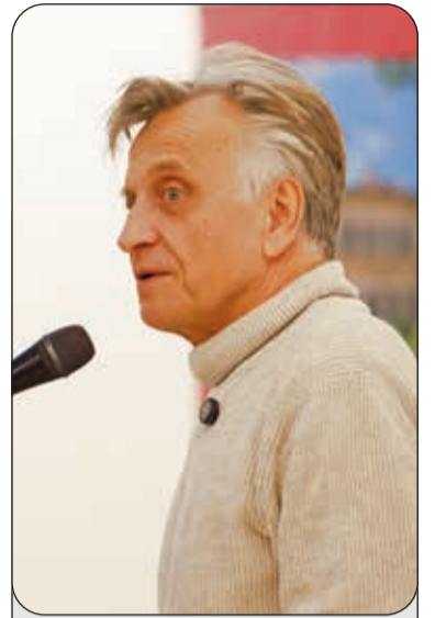
Mácsai Pál színész, rendező