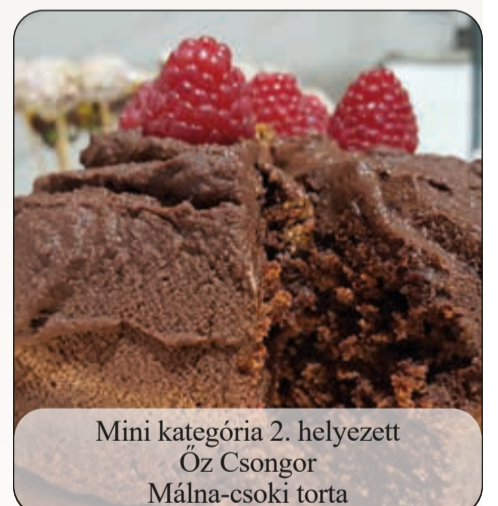
Mini kategória 2. helyezett Óz Csongor Málna-csoki torta