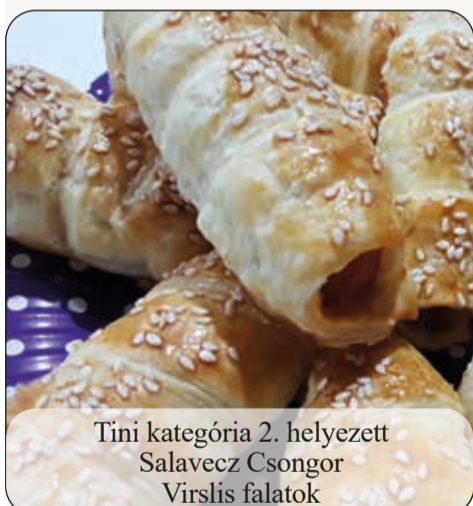
Tini kategória 2. helyezett Salavecz Csongor Virslis falatok