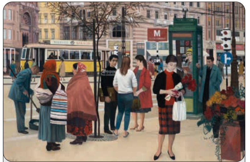
Mácsai István: Pesti utca, 1961.