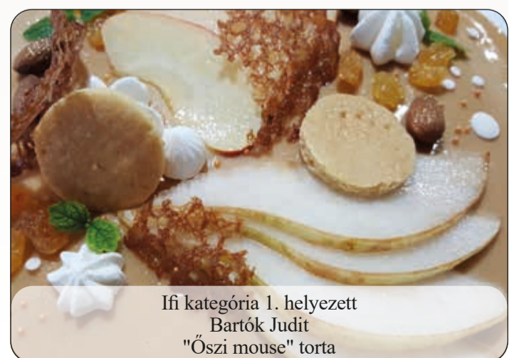
Ifi kategória 1. helyezett Bartók Judit "Őszi mouse" torta