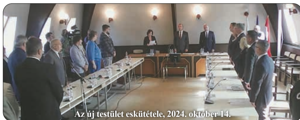
Az új testület esküdtétele, 2024. október 14.

Megkereséseket szívesen fogadok: szabo.miklos@mihazank.hu