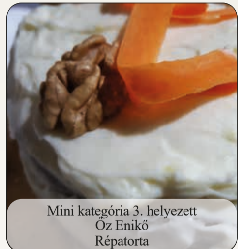
Mini kategória 3. helyezett Óz Enikő Répatorta