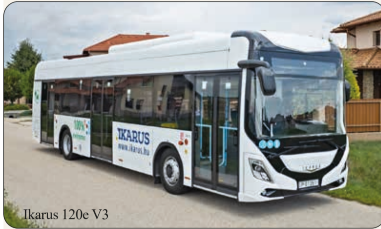
Ikarus 120e V3

A Volánbusz Zrt. a járművek vásárlására és a hozzájuk kapcsolódó töltő infrastruktúra kiépítésére összesen 4,43 milliárd forintos támogatást nyert. A döntés értelmében Balatonfüredre 3, Hajdúszoboszlóra 1, Keszthelyre 1, Komáromba 2,