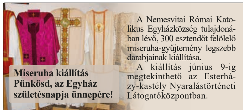
Miseruha kiállítás Pünkösd, az Egyház születésnapja ünnepére!

A Nemesvitai Római Katolikus Egyházközség tulajdonában lévő, 300 esztendő felüli miseruha-gyűjtemény legszebb darbjainak kiállítása.