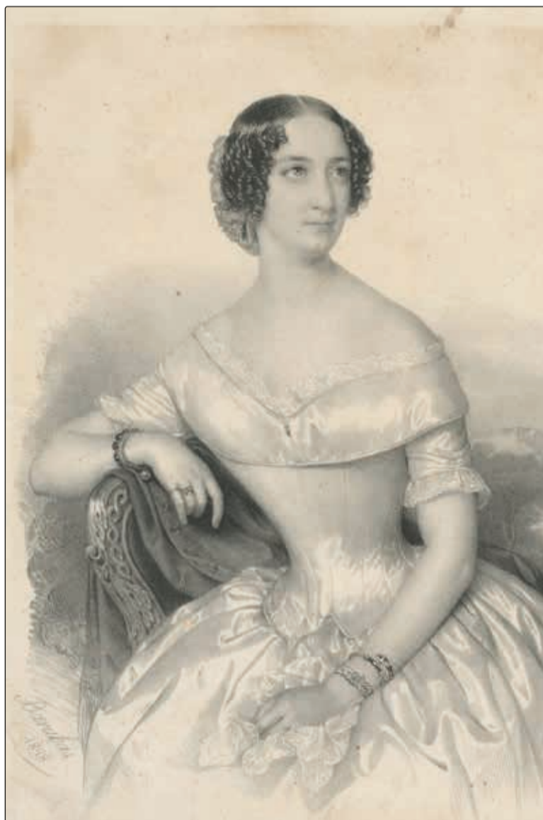
Laborfalvi Rózáról készített litográfia 1848-ból

Annak viszont elragadó példáját adta az avatás előtti napon, hiszen 30-án július hóban, mondhatnám, hajóavatás előtti ünnepet rendeztek a színházban.