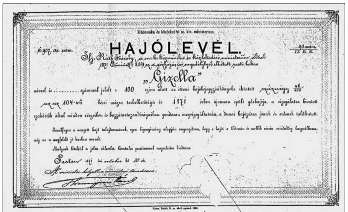
A Gizella hajólevele 1871-ből

még senki nem gondolt. Azért egy újabb gőzös a Balatonon nagy esemény s kétségkívül a fejlődés látható, sőt füstölgő jele. Délután öt órakor indult volna a ceremónia, csakhogy egész nap úgy ömlött az eső, mintha dézsából öntötték volna. Hidegnek nem volt hideg, de egy ilyen özvíz elől nincs menekvés. Minden nagyon ki lett találva, Jókai lett a hajó „ keresztapja ”, a keresztanyai tisztség pedig a tulajdonos feleségéé, Ráth Károlynéé lett, akiről a