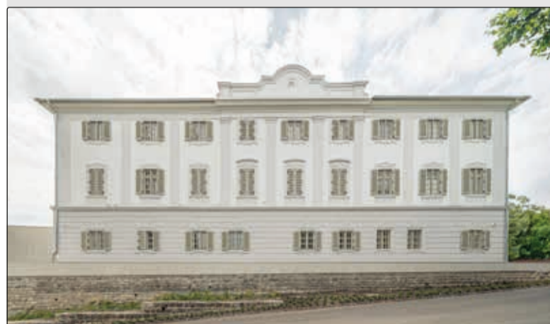
Esterházy-kastély Nyaralástörténeti Látogatóközpont