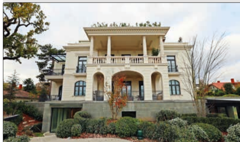
Hotel Petit Bois, Balatonfüred