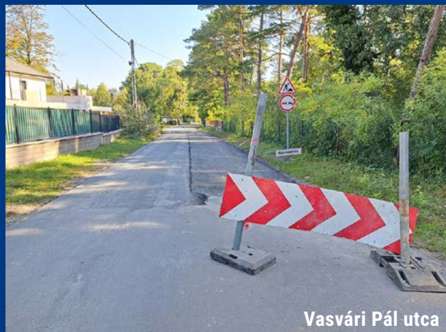
Vasvári Pál utca