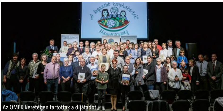
Az OMÉK keretében tartották a díjátadót