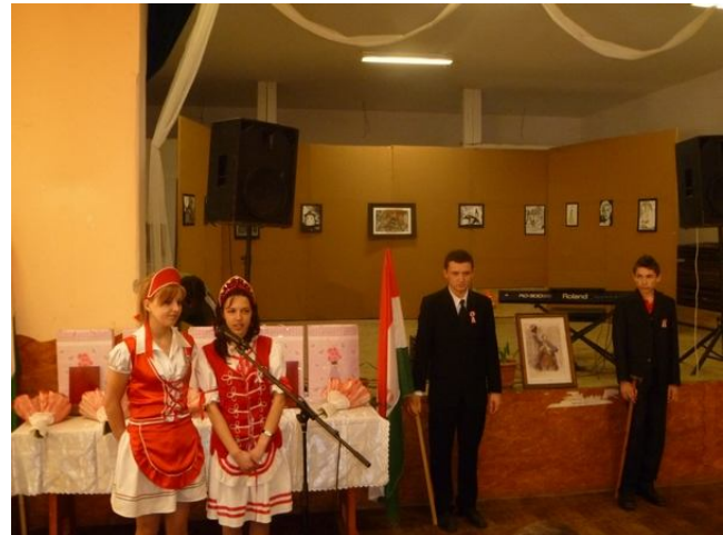
A fiatalok díszőrséget álltak a magyar zászló mellett