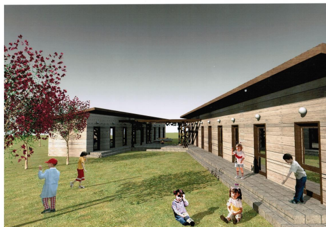
A diáktábor látványterve