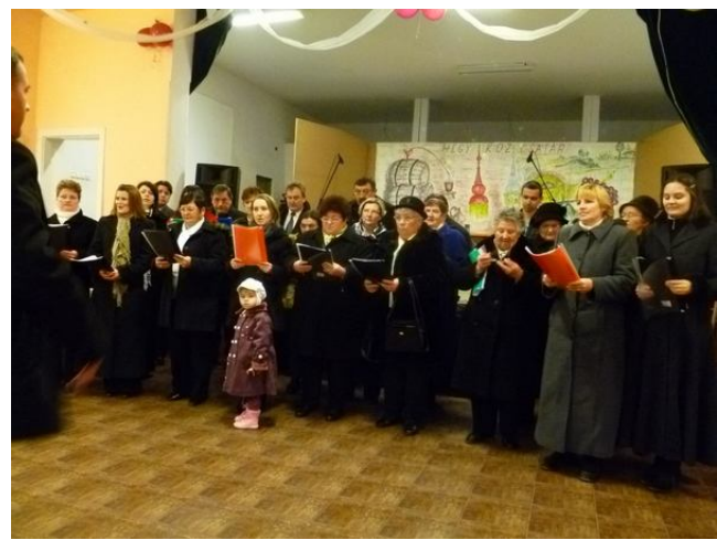
A Falu Karácsonyán Hegyközcsatárban együtt ünnepeltek a község lakosai felekezeti hovatartozás nélkül, a Csatári református és a Tötteleki római katolikus vegyes kórus nagy sikerrel szerepelt