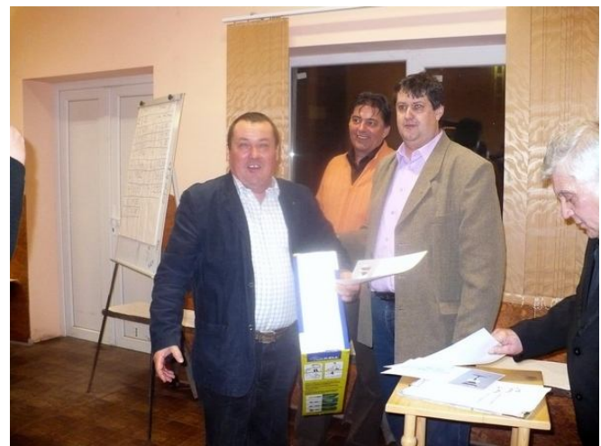
Örül a győztes, hiszen 2009-ben az ő bora lett a legjobb a Hegyközön