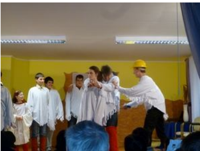
Farsangi mulatság Hegyköztötteleken 2012 februárjában