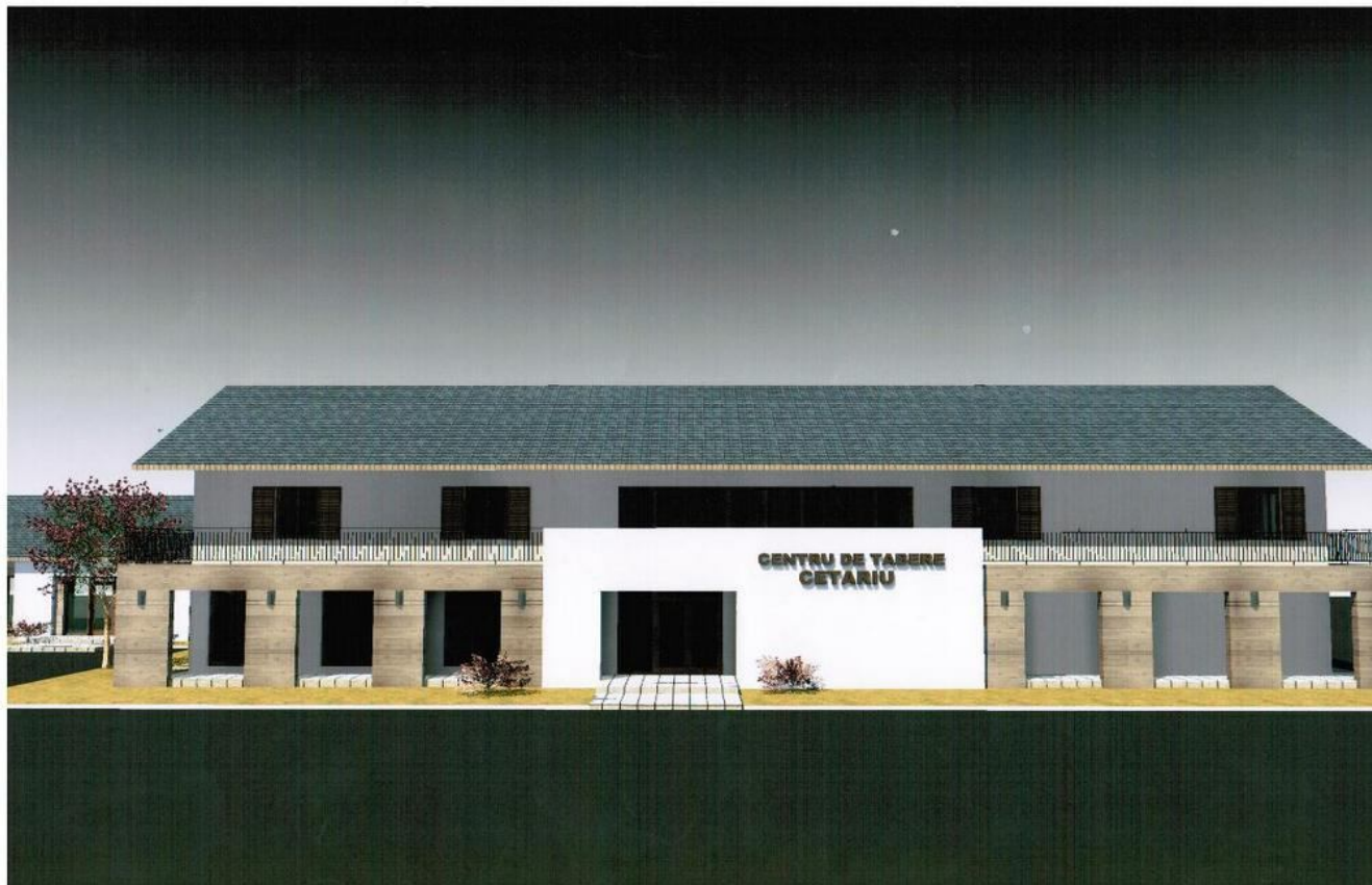
A diáktábor látványterve

Ellentétben a rosmájú híresztelésekkel a Hegyközcsatár község (Csatár, Tóttelek, Sítér és Sítervölgy) gyerekei a rövidesen felépülő sportkomplexumot és diáktábort INGYEN ÉS BÉRMENTVE használhatják majd .