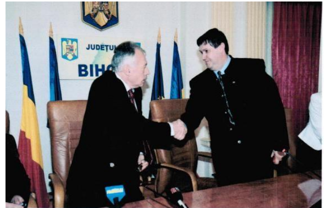
Borbély László egykori környezetvédelmi miniszter és Vitályos Barna Hegyközcsatár polgármestere a szennyvízhálózat megépítéséről szóló szerződés aláírásakor