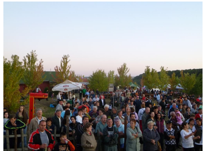
Sokan kijöttek a sítéri tónál megrendezett Gesztenye fesztiválra, ahol élő koncertet adott a 3+2 együttes