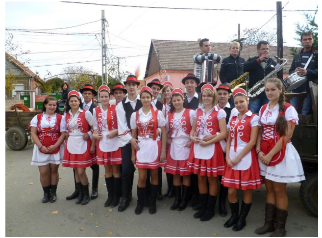
A sítéri szüretibálosok hívogatnak Csátárban 2011