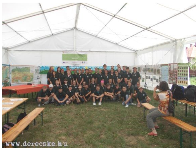
A hegyközcsatári és a derecskei gyerekek egy közös fotón