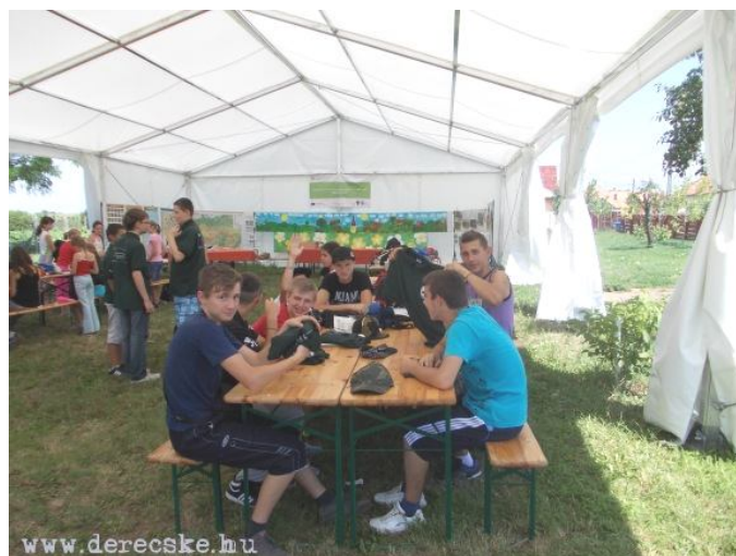
A gyerekek vidáman ismerkednek, barátkoznak egymással

Hegyközcsatár és a magyarországi Derecske együttműködésének egyik első eredménye az a gyermektáboroztatással kapcsolatos projekt, amelyet a Magyarország- Románia Határon Átnyúló Együttműködési Program 2007-2013 keretében az Európai Regionális Fejlesztési Alapból finanszírozott, és amelynek a költségvetésből a táboroztatáson és a személyi kiadásokon túl jelentős összeg fordítható eszközvásárlásra, többek között egy mobil tanteremként szolgáló kétszáz négyzetméteres sátor.