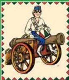
Gábor Áron rézágyúja

A Hégyközcstár községi RMDSZ, Önkormányzat, Polgármesteri Hivatal, a református és római katolikus egyházközségek szervezésében 2015 március 15-én, vasárnap délelőtt 10,30 órai kezdettel ünnepi műsor keretén belül emlékeznek meg 1848 március 15-re a helyi református templomban egy ökumenikus Istentisztelet keretén belül, majd koszorúzásra kerül sor a református templomkertben lévő kopjafánál és a római katolikus templom falán elhelyezett emléktáblánál, amelyre szeretettel várunk mindenkit.