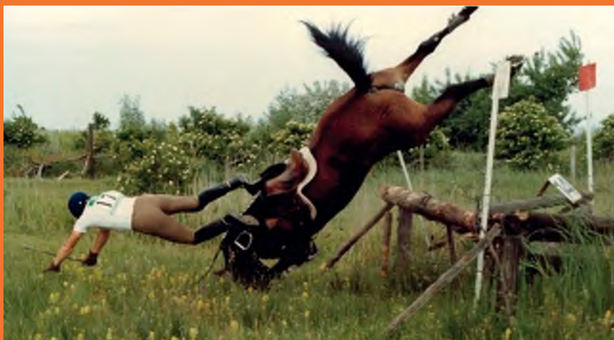
■ E sorok szerzője ezen a fotón Napfény nevű lovával látható 1983-ban