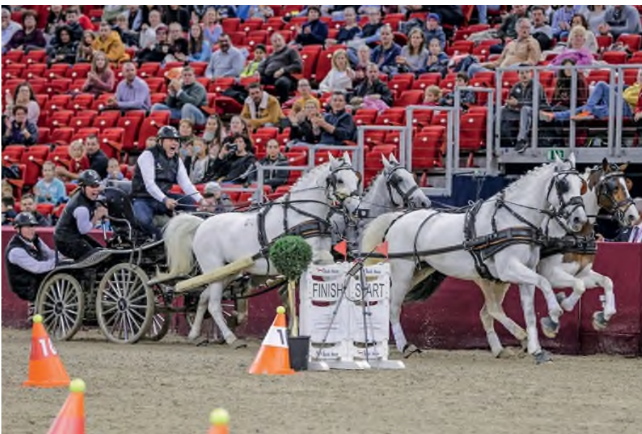
■ Tavaly a holland IJsbrand Chardon nyert a budapesti fedett pályás világbajnokság-fordulón

A folytatásban december 5-én Hortobágy ad otthont a negyedik hazai fedett pályás fogathajtóversenynek, majd az említett decemberi és februári tápiószentmártoni fedeles versenyek után ismét Budapest lesz versenyhelyszín, március 27-28-án.