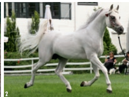
■ 1. Vidám, a zabolai Mikes Birtok jó képességű székely ló heréltje I 2. Hamad B, a cseppvér-keresztelésre vásárolt arab telivér mén

re, hanem erre sarkall a jelenben való haszna miatti racionalitás is” – hangsúlyozza Bodó Imre.