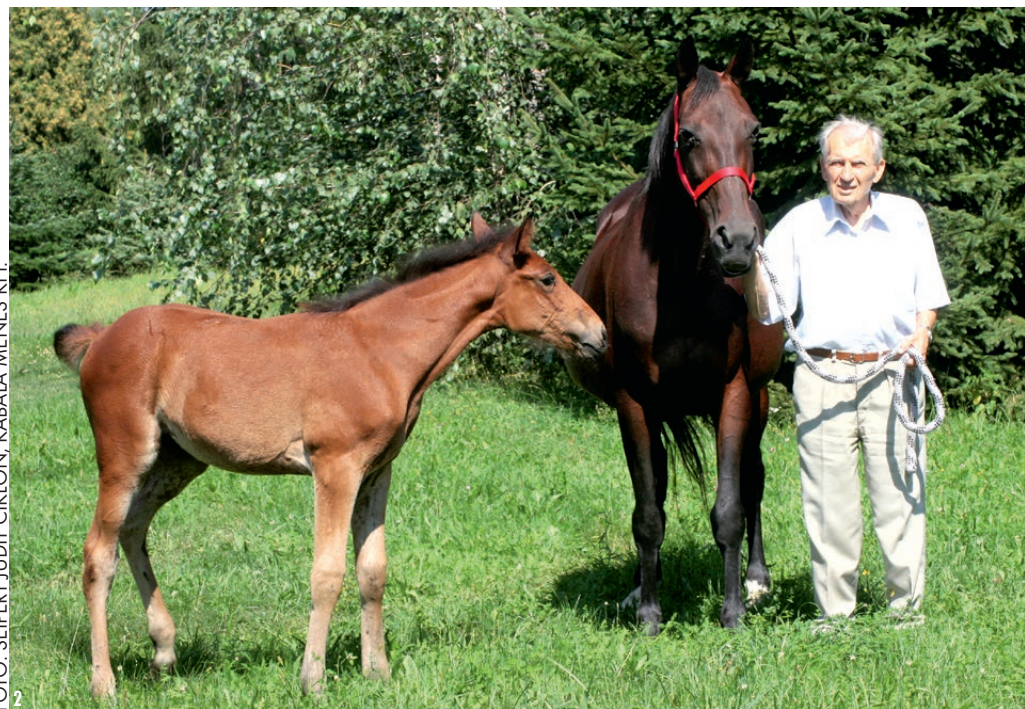
FOTÓ: SEIPERT JUDIT / CIKLON, KABALA MÉNES KFT.

El kellett telnie pár hónapnak, mire visszazökkenem a ménesi létbe. Azt mondták, hogy innentől kezdve a tenyésztésben számítanak rám. Zsóka, a doktornőm nagyon érti a dolgát, az évek alatt sok-sok kicsikóm született. Az elsőnek Witsend's Speedy lett az apja, Háremhölgynek (rek. 17,4) neveztek el. Már az első ivadékomból jó ló lett