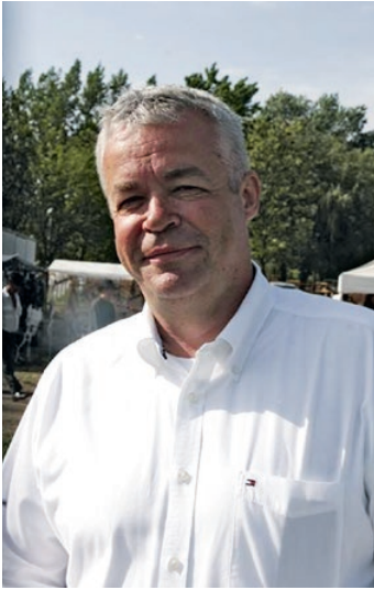
Tóth Tamás szövetségi kapitány