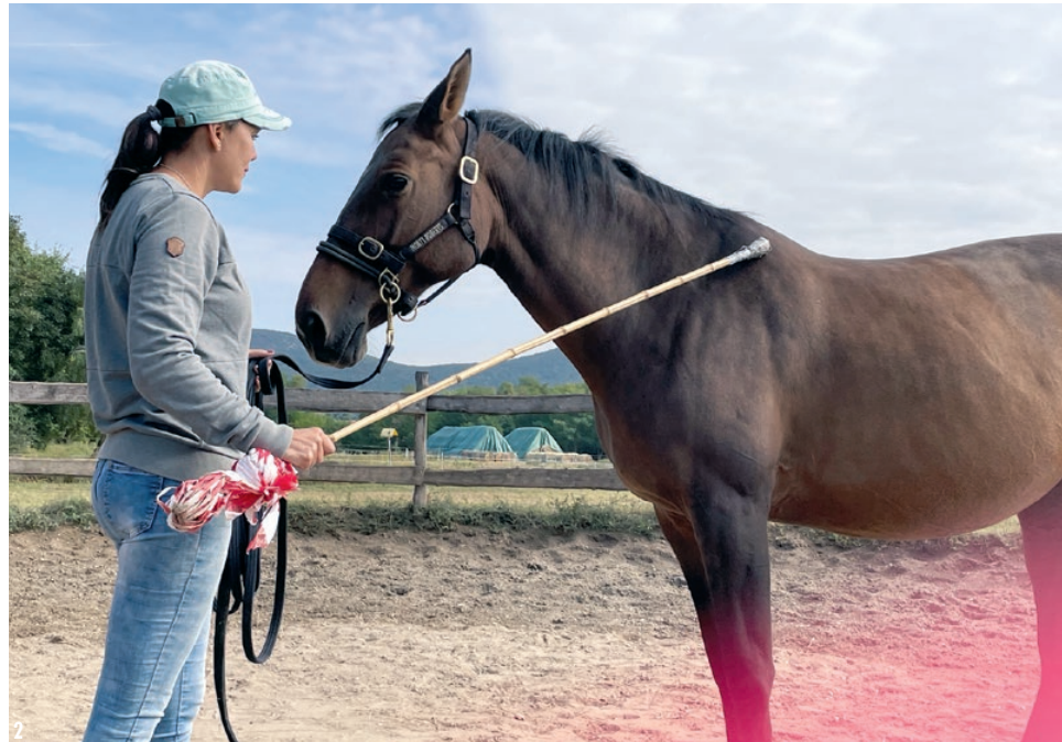
■ 1. A kettős kötőfék | 2. Először a pálca zacskó nélküli végét érintem a ló marjához

Bizonyára sokan egyetértenek velem abban, hogy mindannyian olyan lovat szeretnénk, amely bízunk bennünk, együttműködő és nincsenek komoly fóbiái. Mivel a lovak ösztönösen félnek és menekülnek minden számukra ismeretlen környezeti ingertől, ezért a biztonságos és problémamentes lovasélményhez szükség van a lovak érzéketlenítésére, szoktatására, vagy ha úgy tetszik közömbösítésére különféle, a környezetben jelentkező ingerekkel szemben. A lovak „újfóbiásak”, ami azt jelenti, hogy minden, ami számukra új – tárgy, szituáció, zaj stb. –, az egyenlő a veszéllyel, és