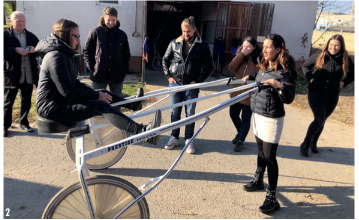
■ 1. A Testnevelési Egyetem hallgatóival | 2. Minden a gyakorlatban dől el | 3. Kaposvári hallgatók | 4. Lovaskultúra-oktató szakosok | 5. Debreceni egyetemisták