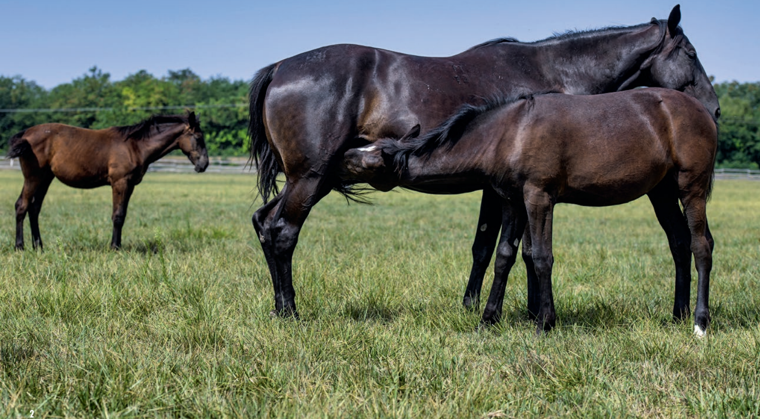
1. Páll László: A szénáhozam alapján a Zöld Ász és a Zöldítő 15 nevű keverékeket tudom kiemelni | 2. Kanca csikójával

nül. De ilyen keverékkel vetették be a 81-es kaszálót is, amely a pitvarosi útról látszódik.