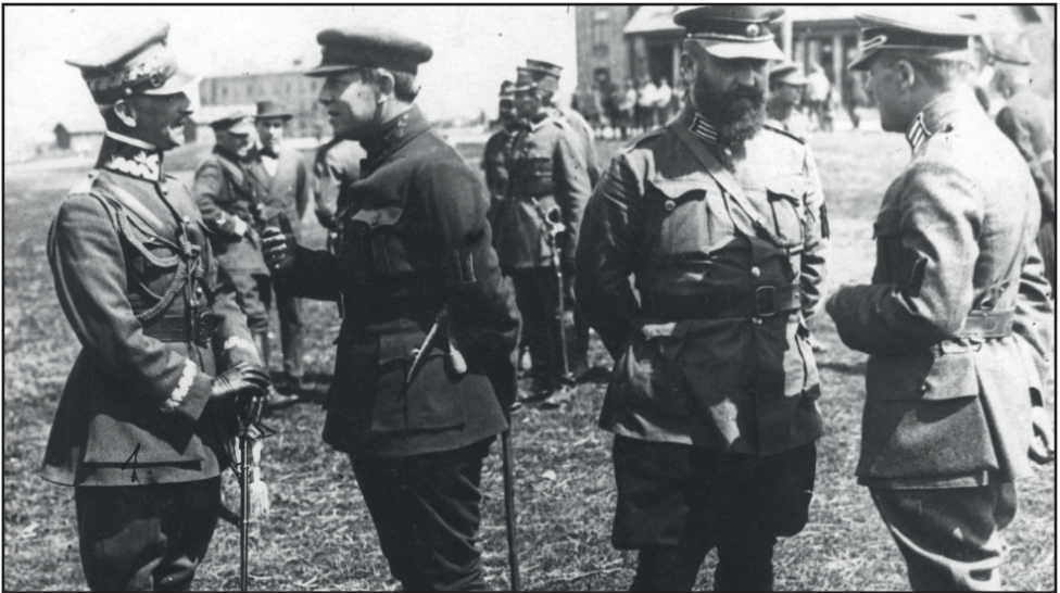
A címlapképen Antoni Listowski tábornok (balról az első) és Szimon Petljura atamán (balról a második) beszélget 1920 áprilisában.

„Bocsánat, uraim, nagyon sajnálom. Ennek nem így kellett volna történnie.”