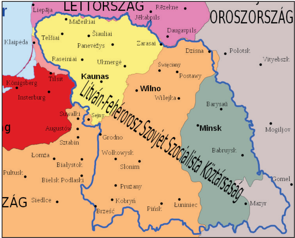
Litván-Belarusz Szovjet Szocialista Köztársaság 1919-ben.

vilniusi régióban lakókhöz, azonban nem jutott elegendő idő a terület lengyel konszolidálására a szovjetek újbóli előretörése miatt. További problémát okozott a litván kormánynak, hogy a Párizs környéki béketárgyalásokon a nyugati nagyhatalmak nem ismerték el Litvánia függetlenségét. Azonban a lengyelek – mint a békekonferencia hivatalos résztvevői – követelték Litvánia Lengyelországhoz csatolását.