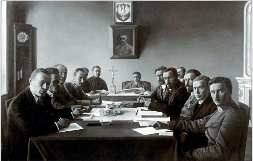
A suwalki egyezmény aláírása. Baloldalon a lengyel, jobboldalon a litván delegáció.

A szovjet csapatok Litvánián keresztül menekülését a litvánok sem tudták tagadni, ami elég indokot jelentett Lengyelországnak a Litvániába való betörésére.