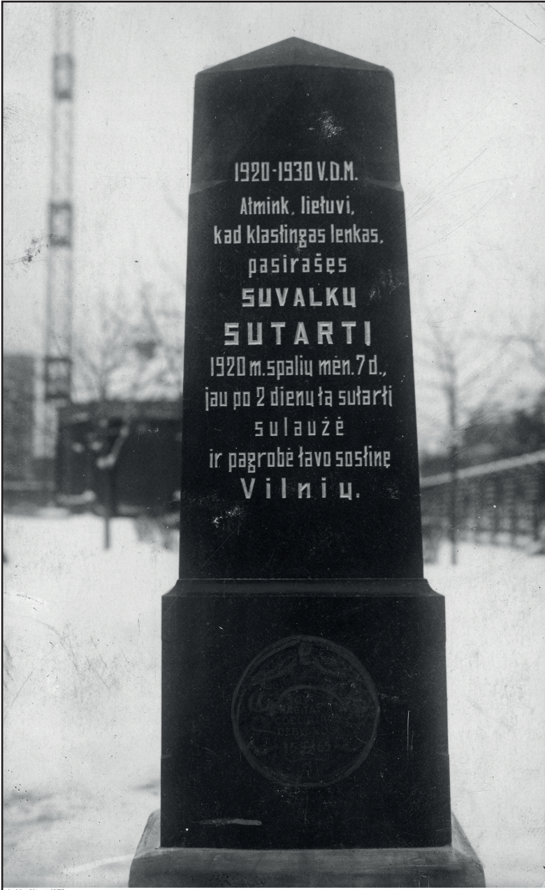
A "Fekete emlékmű" Kovnóban – A litvánok 1930-ban állították a suwałki egyezmény aláírásának 10. évfordulóján, emlékeztetve a lengyelek szőszegésére és Żeligowski "felkelésére".