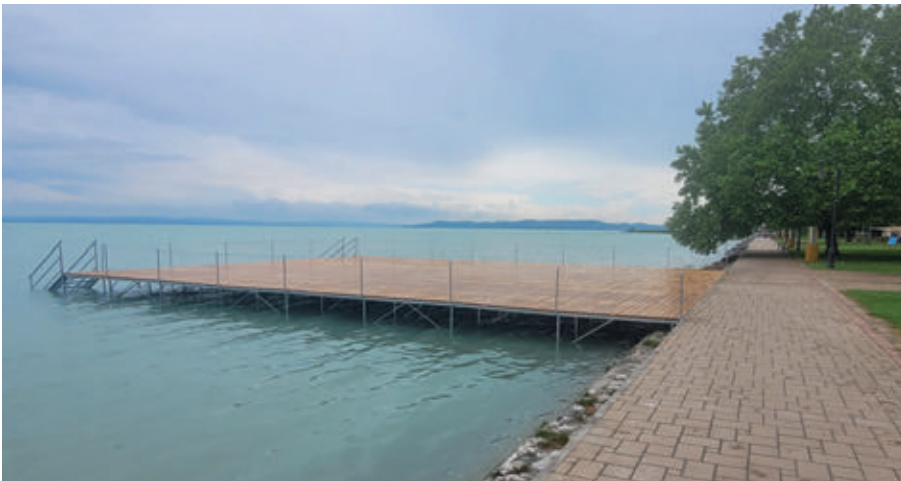
Új, 300 m 2 -es stéget helyeztünk el a strandon