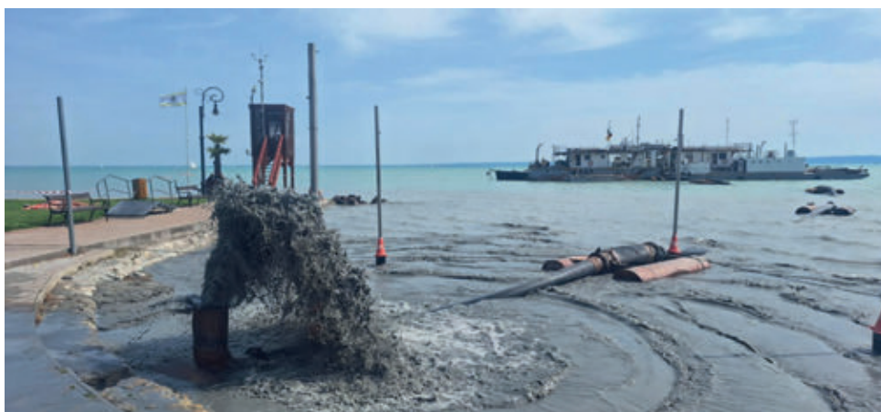
Elvégeztük a strandon a mederhomokozást