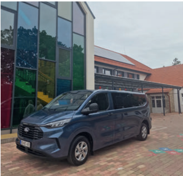
Megérkezett a Csupaki Református Általános Iskola új kisbusza