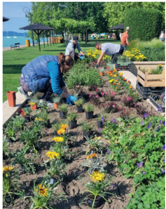
Nyitásra szépítettük a strandunkat